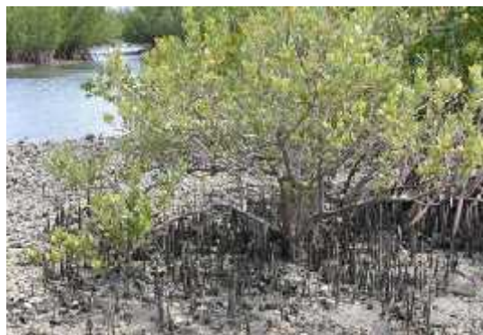
Slika 4. Avicennia germanis

U unutrašnjosti zajednice nalaze se crne mangrove kod kojih se pneumatofori uzdižu iz tla i okružuju deblo. Ovakve prilagodbe korijenskog sustava omogućuju dopremanje kisika korijenju u tlu koje se često nalazi u anaerobnom sedimentu.