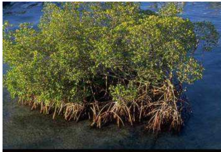
Slika 3. Rhizophora mangle

Crvene mangrove možemo pronaći na rubu zajednice gdje su potpuno izložene utjecajima plime i oseke kao i vjetru. Razvile su adaptacije na navedene uvjete kao što su vrsto korijenje koje se proteže do debla i granja. Ovako zamršeni korijenski sustav povećava stabilnost te također zadržava sediment i sprječava njegovo odnošenje vodom.