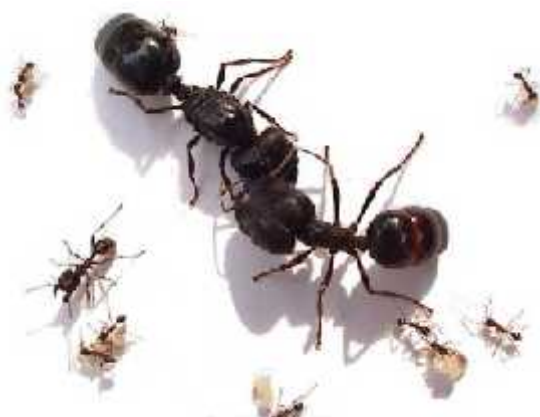
Slika 3. Usporedba veli ine jedinki kod vrste Pheidologeton diversus

U kolonijama postoji nekoliko oblika mrava radnika (naj eš e tri – manji, srednji i najve i) kod kojih postoje fizi ke razlike u veli ini (polimorfija). Ve i mravi, radnici snažnijih eljusti modificiranih za borbu, odlika su „vojnika“ ije se dužnosti ne razlikuju od dužnosti ostalih radnika sve dok nije potrebno štititi zajednicu. U nekoliko vrsta srednji su radnici odsutni, stvaraju i oštru razliku izme u manjih i ve ih mrava radnika. Najmanje i najve e radnike nalazimo kod vrste Pheidologeton diversus (sl.3) gdje je ta razlika gotovo 500 puta. (Moffett, Tobin 1991.)