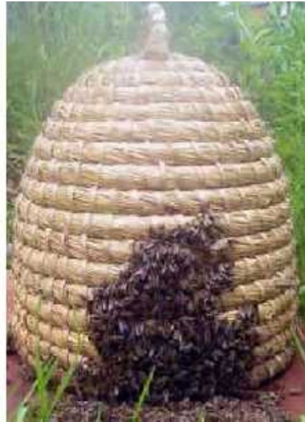
Slika 7. Pletara