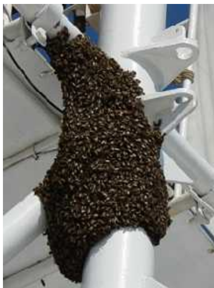
Slika 5. Roj pčela

Uzroci rojenja mogu biti mnogi, primjerice ako je prevelik broj pčela u zajednici, ako se ne može izlučiti vosak i graditi saće, ako ventilacija nije dostatna, ako se stvara višak materijala, ako je matica stara i mnogi drugi.