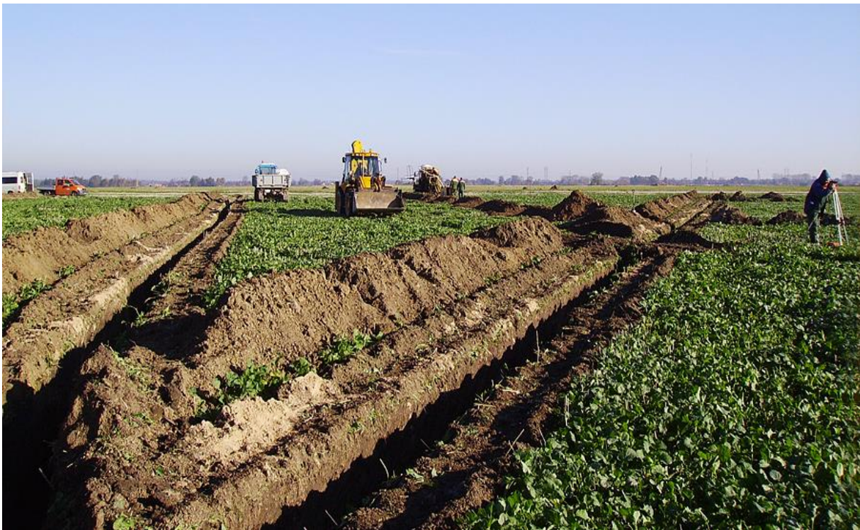
Slika 3. Postupak melioracije zemljišta

Cilj tog zakona bio je zaokruživanje seoskih gospodarstava u što jedinstveniji kompleks obzirom da je prethodno zbog rascjepkanosti seoskih gospodarstava došlo do slabijeg iskorištavanja određenih parcela. Doneseni zakon nije udovoljavao svim očekivanjima pa je 1902. usvojen novi zakon poznat kao Hrvatski zakon o komasaciji zemljišta prema kojem su se komasacije provodile narednih 50ak godina. Kasnije tijekom povijesti donosilo se još zakona o komasaciji, a sve s ciljem unapređenja poljoprivredne proizvodnje. Od osamostaljenja Republika Hrvatska nije pridavala veću pozornost komasaciji, a djelovanje geodetske struke bazira se uglavnom na sređivanju postojeće evidencije (internet) te državnoj katastarskoj izmjeri, koje za svrhu imaju, prije svega, „legalizaciju“ postojećeg stanja na terenu i rješavanje imovinsko-pravnih odnosa na obuhvaćenom području kroz zemljišnoknjižni ispravni postupak te izradu suvremenih (digitalnih) katastarskih planova. (Slika 4.)