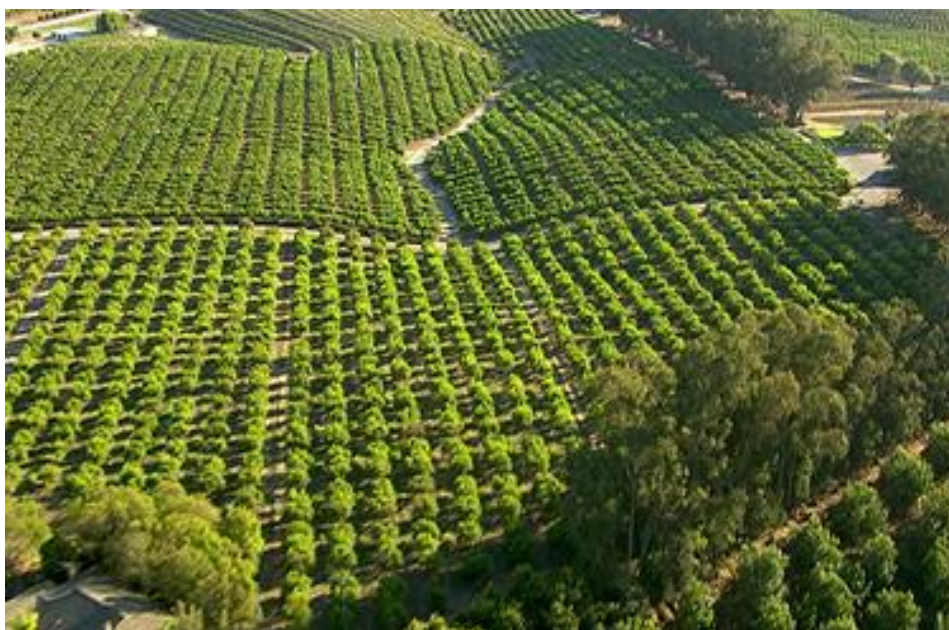
Slika 5. Poljoprivredno zemljište nakon komasacije

zadovoljenja općih potreba (izgradnja škola, vrtića, ambulanti, športskih igrališta itd.). Nakon provedene komasacije jednostavnije je održavanje katastra odnosno katastarskih planova te se omogućava stvaranje poslovnih zona i lakša promocija lokalnih razvojnih projekata. Općenito, potiče se decentralizacija te jača uloga i odgovornost lokalnih nositelja vlasti, u cijeli projekt se uključuju i lokalne agencije. Za dio stanovništva prilika je da tijekom komasacije jednostavnije i povoljnije ponude ili prodaju svoje poljoprivredne površine. Država, zbog boljeg korištenja (ograničenog) zemljišnog potencijala, potiče količinski veću i konkurentniju poljoprivrednu proizvodnju, veću zaposlenost te ostanak u ruralnom prostoru. Uredne vlasničke knjige olakšavaju i potiču tržište poljoprivrednim zemljištem te se često „otkriva” nekada uzurpirano državno poljoprivredno zemljište. Nakon komasacije lakše se sprječava „uzurpacija“ poljoprivrednog zemljišta za različite nepoljoprivredne namjene, ali ispravlja i često proširuje granice građevinskog dijela naselja što olakšava legalizaciju i uknjižbu objekata. Da bi se sagledao gospodarski učinak nakon provedene komasacije zemljišta, trebalo bi odgovoriti na pitanje u kojoj je mjeri komasacija omogućila uštedu rada i za koliko je povećala prinose poljoprivrednih proizvoda u pojedinim gospodarstvima (Grgić i sur, 2016).