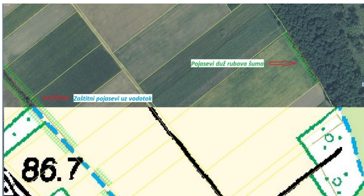
Slika 4. Prikaz digitalnog katastarskog plana

To međutim ne rješava još uvijek prisutno stanje usitnjenosti i rascjepkanosti poljoprivrednog zemljišta na području Republike Hrvatske u cjelini. Poljoprivredne površine su najbogatije rizične biljnih i životinjskih vrsta te osnovna sastavnica krajobraza. Za očuvanje i unapređenje biološke i krajobrazne raznolikosti u poljoprivredi posebno važno za održivi razvitak Hrvatske. Postavljeni ciljevi poljoprivredne politike u Zakonu o poljoprivredi (NN 66/01.) obuhvaćaju, osiguranje prehrambene sigurnosti stanovništva i promicanje konkurentne poljoprivredne proizvodnje, ali i čuvanje prirodnih resursa, ekološke poljoprivrede te napredak seoskih područja. Komasaacija se provodi na temelju višegodišnjih programa koje donosi Hrvatski sabor za razdoblje od pet godina i godišnjih programa, koje donosi Vlada Republike Hrvatske. Programima se utvrđuju u prvome redu područja na kojima će se provoditi komasaacija, izvori financiranja te rokovi za provedbu Programa (Blašković, 1955.)