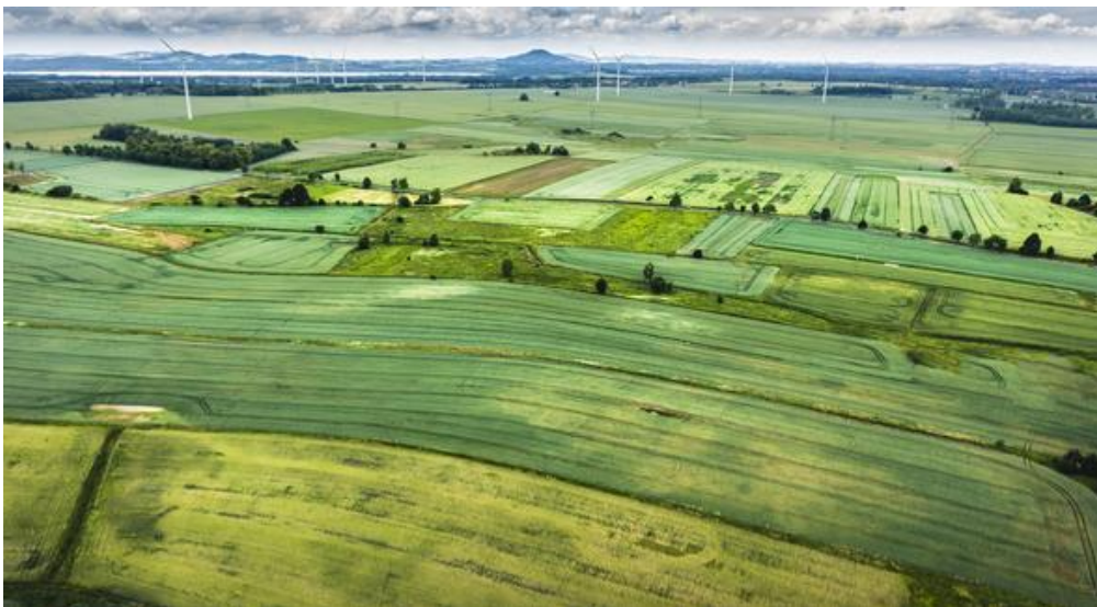
Slika 8. Komasacija poljoprivrednog zemljišta uz održavanje krajobrazne raznolikosti

Na poljoprivrednom zemljištu koje je po načinu uporabe vinograd, voćnjak, maslinik i ribnjak komasacija se može provoditi samo ako na to pristane natpolovična većina njihovih vlasnika, osim ako se radi o katastarskim česticama površine do 0,5 ha čije bi izdvajanje ometalo pravilno provođenje komasacije ili ako se na tom zemljištu grade vodne građevine za melioracije. Važno je napomenuti da se Prilikom provedbe komasacije osobito mora voditi računa o zaštiti tla i voda, bioraznolikosti i krajobraznoj raznolikosti (slika 8.) te zaštiti prirodnih staništa biljnih i životinjskih vrsta, u skladu s posebnim propisima (NN 51/15).