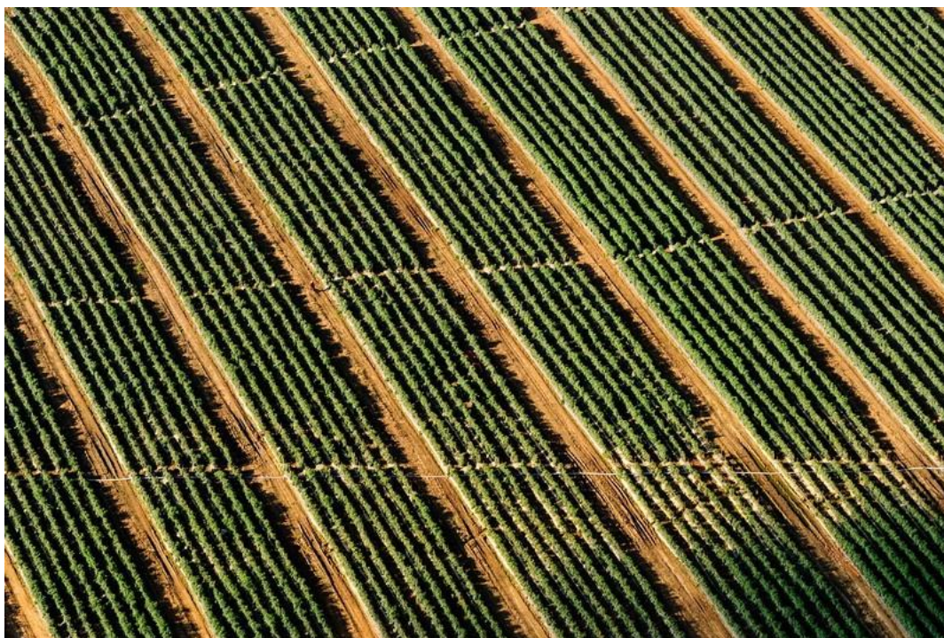
Slika 2. Komascija poljoprivrednog zemljišta