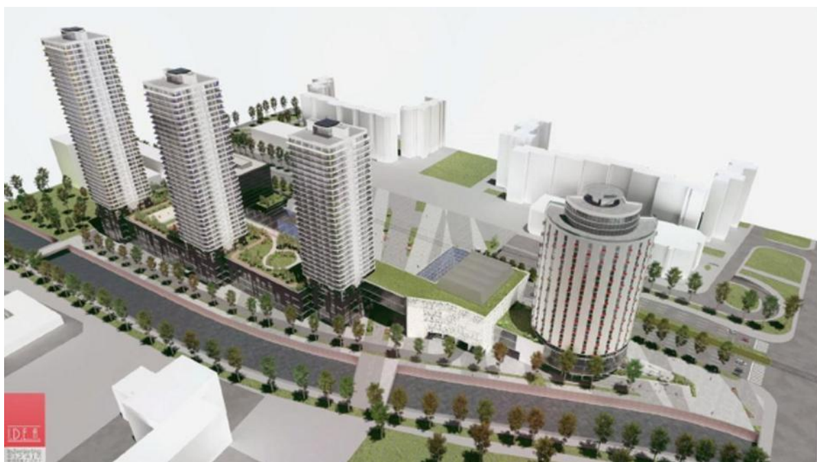
Slika 1. Primjer plana za stambeno poslovni prostor za kojeg je potrebna ekspropiracija

Pojam arondacije obuhvaća zaokruživanje nekog društvenog posjeda. Ova operacija može se provoditi radi izvođenja melioracijskih i protiv erozivnih radnji. Također cilj arondacije može biti i pošumljivanje, podizanje plantaža voćnjaka ili vinograda, racionalnije iskorištavanje i obrada poljoprivrednog zemljišta uz bolje korištenje mehanizacije itd. Za razliku od primjerice komasacije, kod arondacije se ne projektiraju novi putevi niti se izvode objekti hidrotehničkih melioracija. Isto tako, granice, oblik i veličina novih parcela ovise uglavnom o pravilnosti već postojećih putnih i kanalizacijskih mreža. Nedostatak ove operacije je što se većim dijelom provodi za društvene posjede, dok su individualni poljoprivrednici u ovom procesu samo indirektni sudionici.