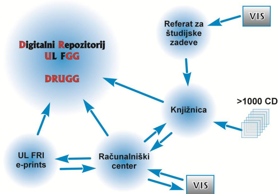
Slika 1: Organiziranost projektne skupine na UL FGG za izgradnjo repozitorija DRUGG

Projekt se je začel v marcu 2011, v tednu Univerze v Ljubljani v decembru 2011 smo repozitorij predali javnosti. Poimenovali smo ga Digitalni Repozitorij Univerze v Ljubljani, Fakultete za Gradbeništvo in Geodezijo, kratko DRUGG ( http://drugg.fgg.uni-lj.si/ ).