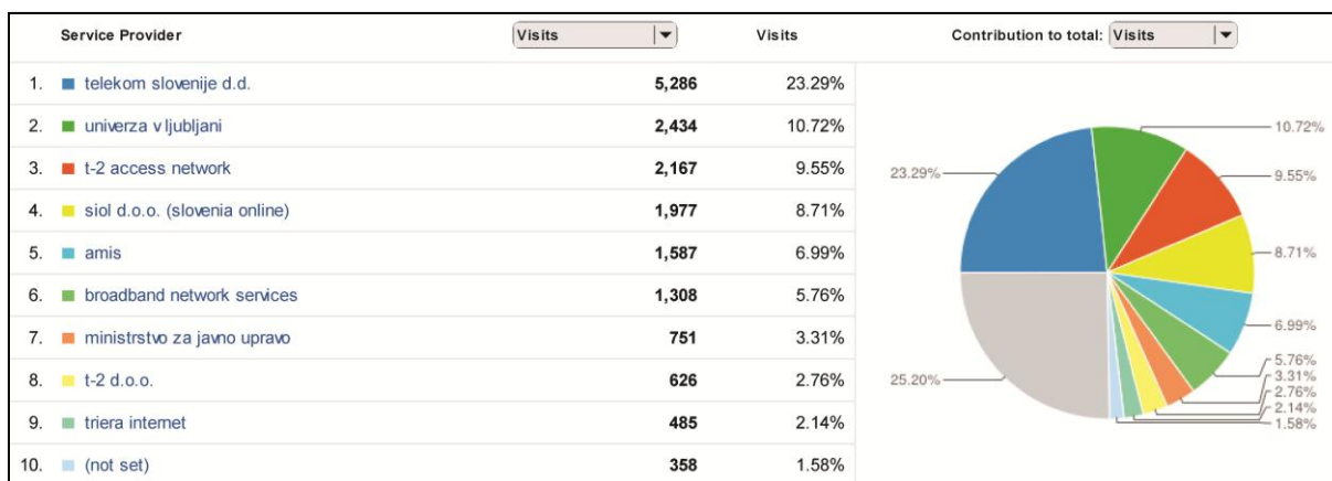
Slika 5: Statistika dostopov iz različnih omrežij

Z Gogle Analytics lahko sledimo tudi statistiki dostopov iz različnih omrežij. Slika 5 kaže, da je 89% vseh obiskov doseženih iz javnih domen, le 11% jih je iz domene Univerze v Ljubljani. To dokazuje, da repozitorij v veliki meri uporablja strokovna javnostin da uporaba ni omejena le na našo univerzo.