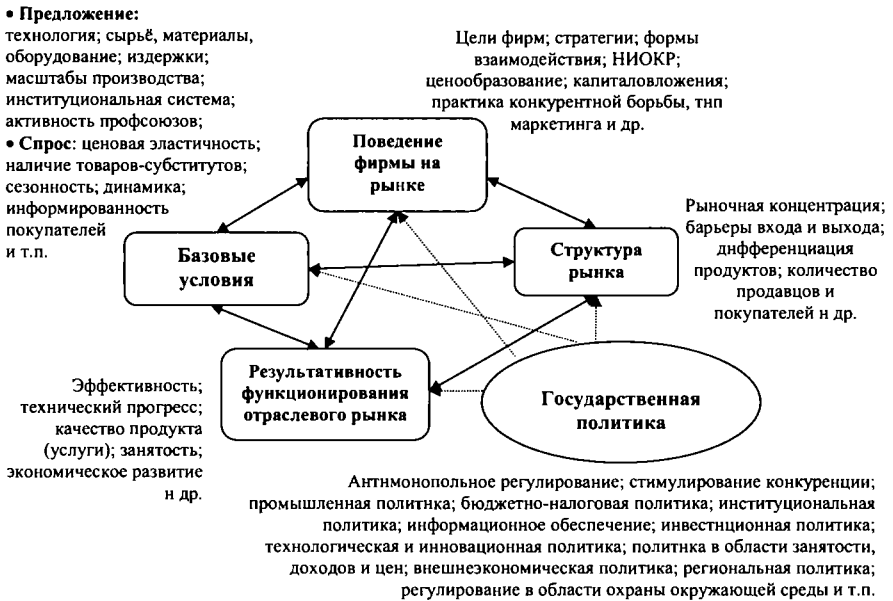
Рис. 1. Структурно-поведенческий подход к государственному регулированию отраслевых рынков

В настоящее время такая интеграция происходит в рамках структурно-поведенческого подхода к исследованию проблемы государственного регулирования отраслевых рынков. Его формирование началось в конце 1930-х годов и связано с так называемой гарвардской парадигмой «структура–поведение–результат» (Э. Мэйсон, Д. Бэйн). Признётся взаимная обусловленность структуры рынка, поведения фирм и результативности функционирования рынка . Государство может улучшить функционирование отраслевого рынка, воздействуя на любой его структурный элемент (см. рис. 1 24 ).