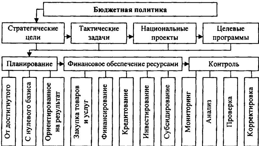
Рис. 3. Механизм реализации бюджетной политики государства

На основе проведенного анализа и с учетом требований по повышению эффективности всей системы государственного управления автором разработан механизм реализации бюджетной политики (рис. 3).