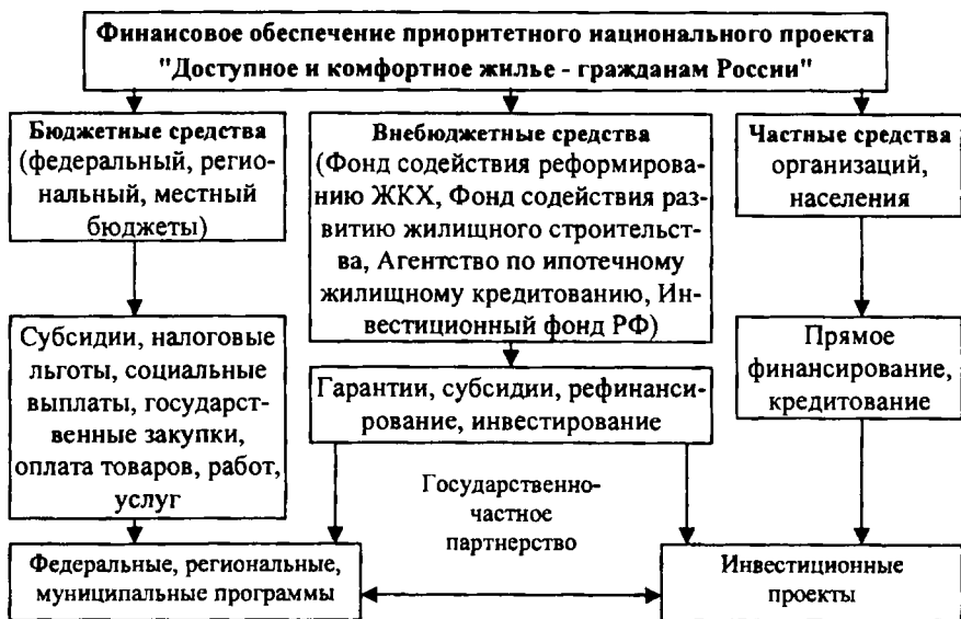
Рис. 4. Схема финансового обеспечения приоритетного национального проекта "Доступное и комфортное жилье - гражданам России"

бюджетных доходов и расходов, на социально-экономическое развитие регионов и муниципальных образований.