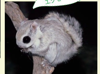
白っぽい冬毛のエゾモモンガ