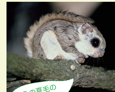
褐色の夏毛のエゾモモンガ

エゾモモンガは1年を通して活動します。春と秋に毛が生え変わり、夏毛は褐色(茶色)、冬毛は白っぽい灰茶の毛色にかわります。冬眠はせず、冬にも1日1度は出てきてえさを食べます。ただし、寒さの厳しい時期の活動時間は短く、明け方近くに1日1回出てきて、1時間弱で巣に帰るときもあります。