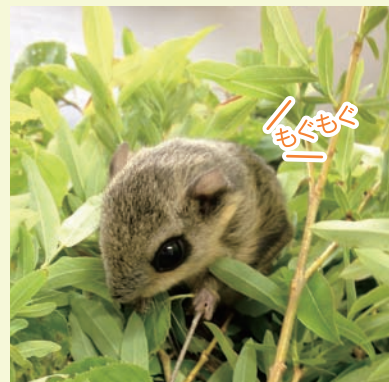
イヌコリヤナギの葉

エゾモモンガはほぼ完全な植物食です。春にはヤナギ類、シラカバ、ハンノキなどの若葉を食べています。夏から秋にかけては、ヤマグワやサクラの実、シラカバ、カエデなどの実、まだ青いカシワやミズナラのドングリを食べます。冬にはシラカバ、ハンノキ、カラマツなどの冬芽や花穂を食べます。