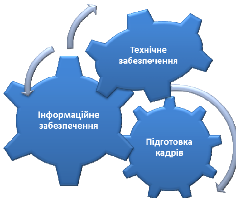
Рис. 2 Складові інформатизації

Але втілення стандартів у практику потребує ґрунтовного аналізу ресурсів та можливостей конкретного навчального закладу та відповідної підготовки його працівників, в першу чергу адміністрації. Оскільки навчальні заклади, навіть у межах одного міста чи району, можуть значно відрізнитись освітньою інфраструктурою, кількісним і якісним складом педагогічного колективу, навчальними планами (наприклад, залежно від типу навчального закладу чи профілю навчання) тощо. Ключовим моментом на шляху до застосування технології „продукування знань”, є аналіз актуального стану інформатизації навчального закладу (рис. 2) з наступним використанням найкращого інноваційного досвіду у якості важелів для розвитку інших компонентів системи. Так, у одній школі може бути більш розвинена технологічна інфраструктура, в другій – педагогічні практики та інновації.