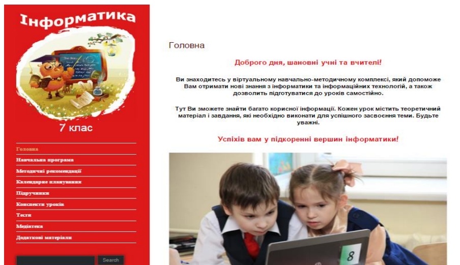
Рис. 2. Головне вікно ЕНМК з інформатики для 7 класу

Текст навчальної дисципліни подано у вигляді HTML-сторінок. Навігація по комплексу здійснюється за допомогою зручного інтерфейсу користувача. З головного вікна учень може здійснити перехід до будь-якого розділу ЕНМК.