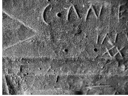
Fig. 6 Detall de la part esquerra del camp epigràfic de CIBal 88 amb l'ajut del llum rasant