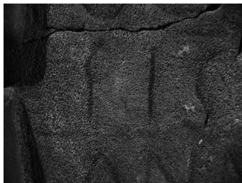
Fig. 1 Detall de CIBal 83 (=CIL II 3671). Tres primeres lletres del sobrenom Pisena