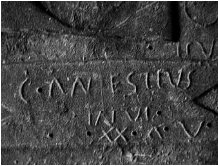
Fig. 3 Detall del camp epigràfic de CI/Bal 88