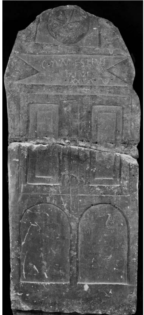
Fig. 4 CI/Bal 88