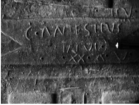
Fig. 5 Detall del camp epigràfic de CIBal 88 amb l'ajut del llum rasant