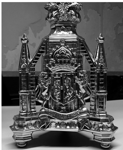
Fig. 1 Fig. 2

Fig. 1 i 2 Francesc Isaura Fargas. Creu de plata i detall de l'escut d'armes Cominges i Foix. 1878