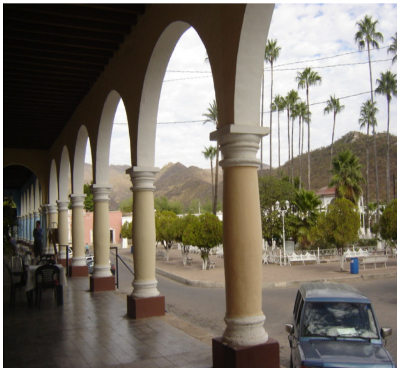
La plaza central