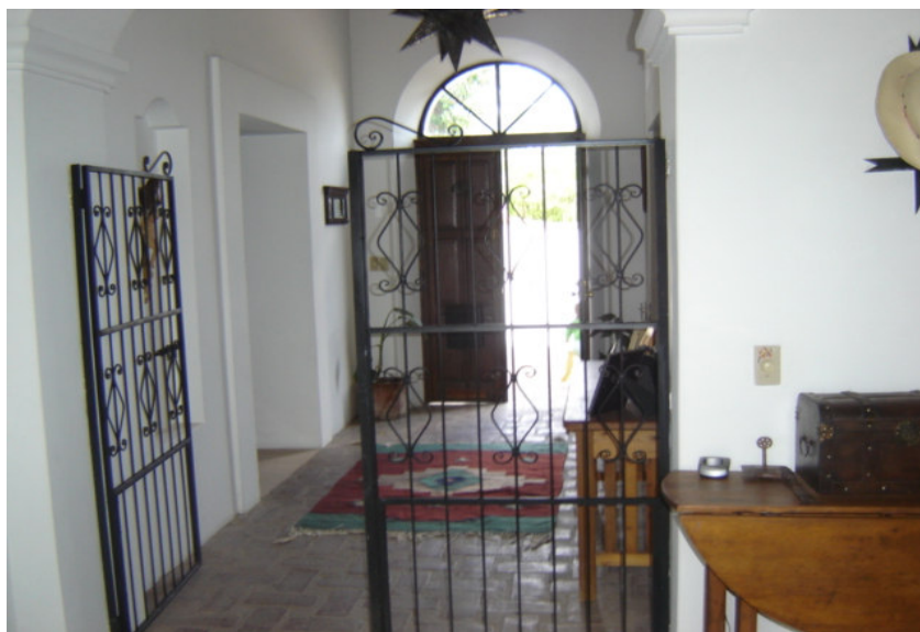
Visto desde el patio. Entrada típica al patio en el barrio de los estadounidenses

Faist (1999) propone una tipología de los espacios sociales transnacionales a partir de la duración en el tiempo de las redes (ya sea de corta o larga duración) y la intensidad con que se producen estos intercambios (débil o fuerte). Dejando a un lado el reduccionismo y las relaciones mecánicas entre variables de toda tipología, la ventaja de la clasificación de Faist (1999) radica en que relaciona el tiempo con la intensidad de las redes. Esto permite diferenciar entre momentos diversos desde las sociedades de destino a la construcción de comunidades transnacionales.