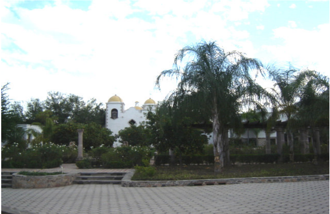
Una mansión rescatada, propiedad de inmigrantes norteamericanos.

La reconstrucción de las casas hecha por los inmigrantes, no intentaba copiar o preservar exactamente del estilo original de las construcciones, sino más bien conformar un estilo colonial mexicano que corresponde a la imagen idealizada que ellos tienen (Clausen 2008). Esto también se debe a razones prácticas; en el momento en que Alcorn llega al Pueblo sólo quedaban en pie las fachadas de las viejas residencias coloniales, además de que no existían planos o fotos que permitieran una reconstrucción exacta. Es posible reconocer en el estilo de la mayoría de las casas una influencia francesa combinada con motivos moros que surgieron en España. Este Pueblo es el único lugar en el Estado de Sonora que rescató y conservó su centro histórico, en gran parte gracias a los recursos e interés de los inmigrantes estadounidenses.