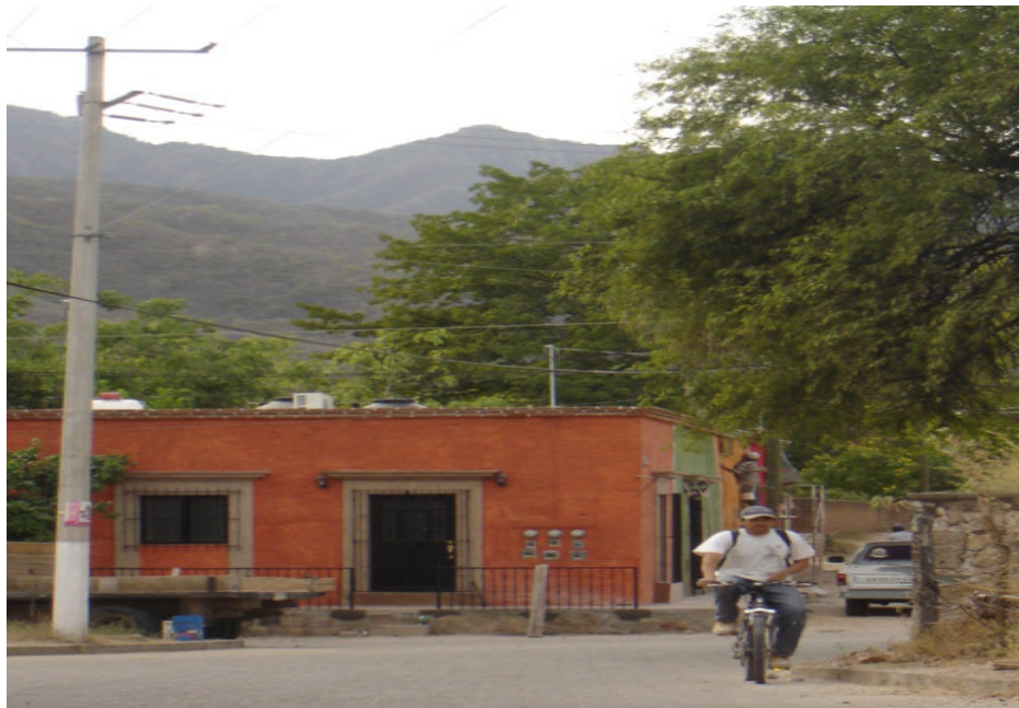
Una calle que forma uno de los límites espaciales entre el barrio de los mexicanos (el muro a la derecha de la foto) y de los inmigrantes norteamericanos (las casas a la izquierda de la foto).