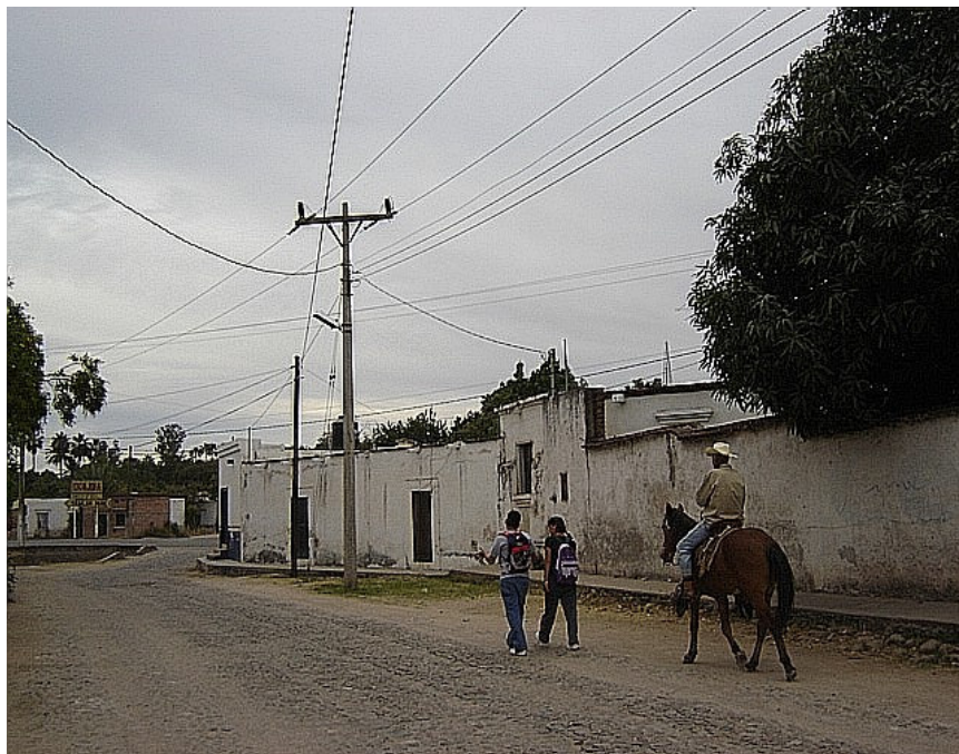
La calle principal en los barrios donde viven los mexicanos.