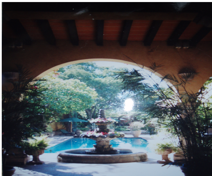
Patio en una de las casas de los norteamericanos.

Es importante notar que esta idealización sobre lo mexicano fue construida en los Estados Unidos, pero no podía ser realizada allí sino únicamente en ciertos lugares de México (Clausen 2008). Por ejemplo, lugares donde ahora se ubican comunidades de inmigrantes norteamericanos como San Miguel Allende, en el Estado de Guanajuato y en Guadalajara, en el Estado de Jalisco (Howells y Merwin 2005) reúnen, al igual que el Pueblo que estudiamos, características que son percibidas por los inmigrantes como una especie de paraíso perdido de lo mexicano auténtico y, que es una razón importante para explicar esta migración. Es decir, que junto a los elementos de racionalidad económica que sustentan esta migración, ocupan un papel esencial elementos como la comodidad material, la tranquilidad, una búsqueda de ciertos paisajes y construcciones, tipo coloniales, que coincidan con esta imagen sobre lo mexicano auténtico. En este caso de estudio el Pueblo está ubicado al pie de montañas fértiles, tiene un clima agradable y sólo una carretera va hacia él. El centro del Pueblo y los barrios de la comunidad norteamericana tienen calles de terrecería con palmeras, y las casas son restauradas en el estilo colonial; los patios y jardines con árboles de frutas y flores exóticas (para los norteamericanos), fuentes de agua adornadas y recámaras con azulejos. Las casas tienen una buscada imagen de privacidad y exclusividad 32 .