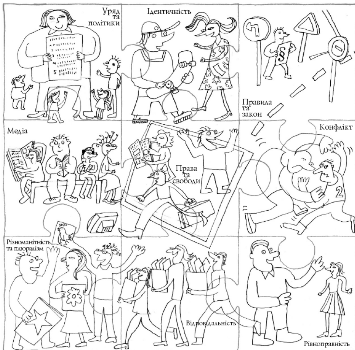
Рис. 3. Пазл-ілюстрація до серії посібників Ради Європи з питань освіти для демократичного громадянства. Автор - П. Віксман, 2009 р. [7,16].

Європи передають взаємозв'язки між поняттями та їх поєднання у навчальних темах (Рис.3) [7,16].