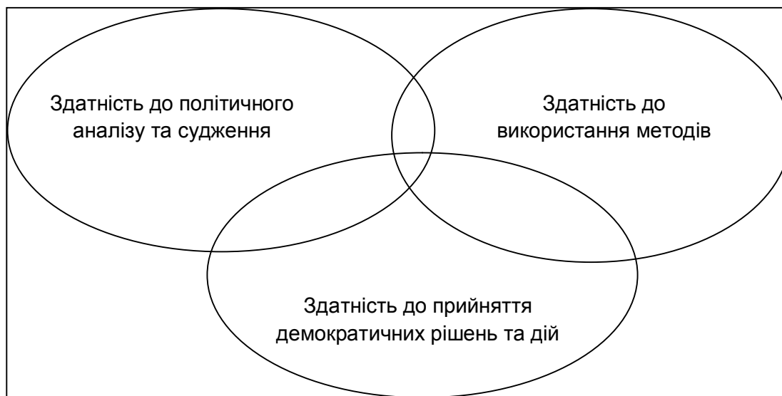
Рисунок 1. Взаємоперетинання сфер громадянської компетентності у трьох складових ОДГ, що подані у категоріях компетентності.

В рамках навчального курсу з освіти для демократичного громадянства та прав людини вищезгадані категорії розглядаються, як сфери, що перетинаються у різних видах навчально-виховної діяльності і розглядаються разом у поєднанні (див.Рис.1.). Розглянемо детальніше вищеподані концепти.