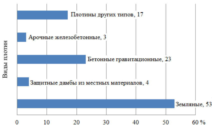
Рис. 1. Процентное соотношение аварий на плотинах различных типов (по данным [1, 2])

Увеличение числа быстровозводимых грунтовых ГТС повлекло за собой рост аварий (рис 1), о чем свидетельствуют статистические данные, приведенные в работах [1, 2, 4].