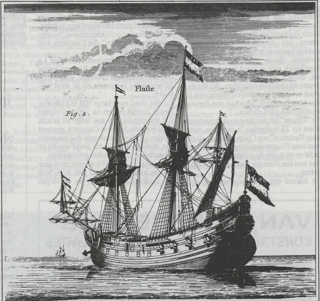
Een fluit (uit de Encyclopédie van Diderot en d' Alembert).

vierennegentig Portugese soldaten transporteerde en die naar Lissabon wilde brengen, werd de Hollander gevankelijk naar Vigo gebracht als goede prijs. De lading werd aangeslagen, de schipper mocht echter "vrijende lybre" vertrekken. En de soldaten? "Middaegs de soldaeten laeten loopen..."! Zo ging dat om geen "enbras" te hebben. We hebben van de