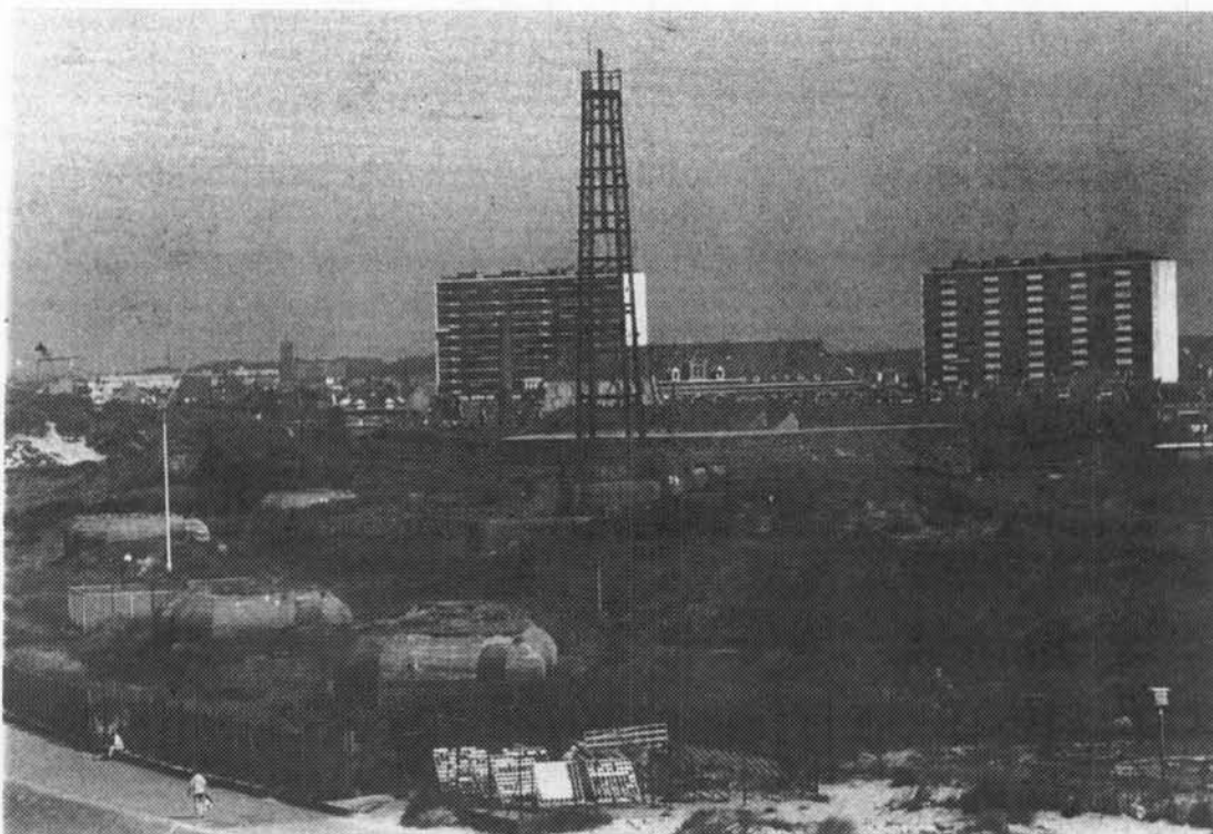
Algemeen beeld van de batterij Hundius. Men ziet op de voorgrond drie van de vier geschutskazematten. Daar achter staat de vuurleidingspost.