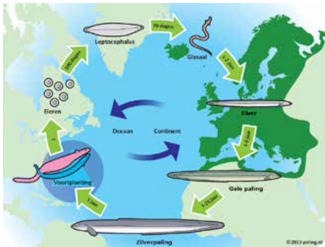
Figuur 1. Levenscyclus van de Europese paling Anguilla anguilla .