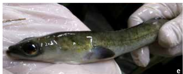
Figuur 2. De verschillende levensstadia van een Paling: (a) wilgenbladlarve in de Atlantische Oceaan, (b) glasaaltje aan de kust, (c) overgang in de estuaria van doorzichtig glasaaltje (onder) naar volledig gepigmenteerde elver (boven), (d) gele paling (boven) en zilverpaling (onder) in de rivier, door subtiële verschillen in oogdiameter, kleur en lengte van de borstvinnen van elkaar te onderscheiden en (e) mannelijke zilverpaling met opvallend grote ogen.