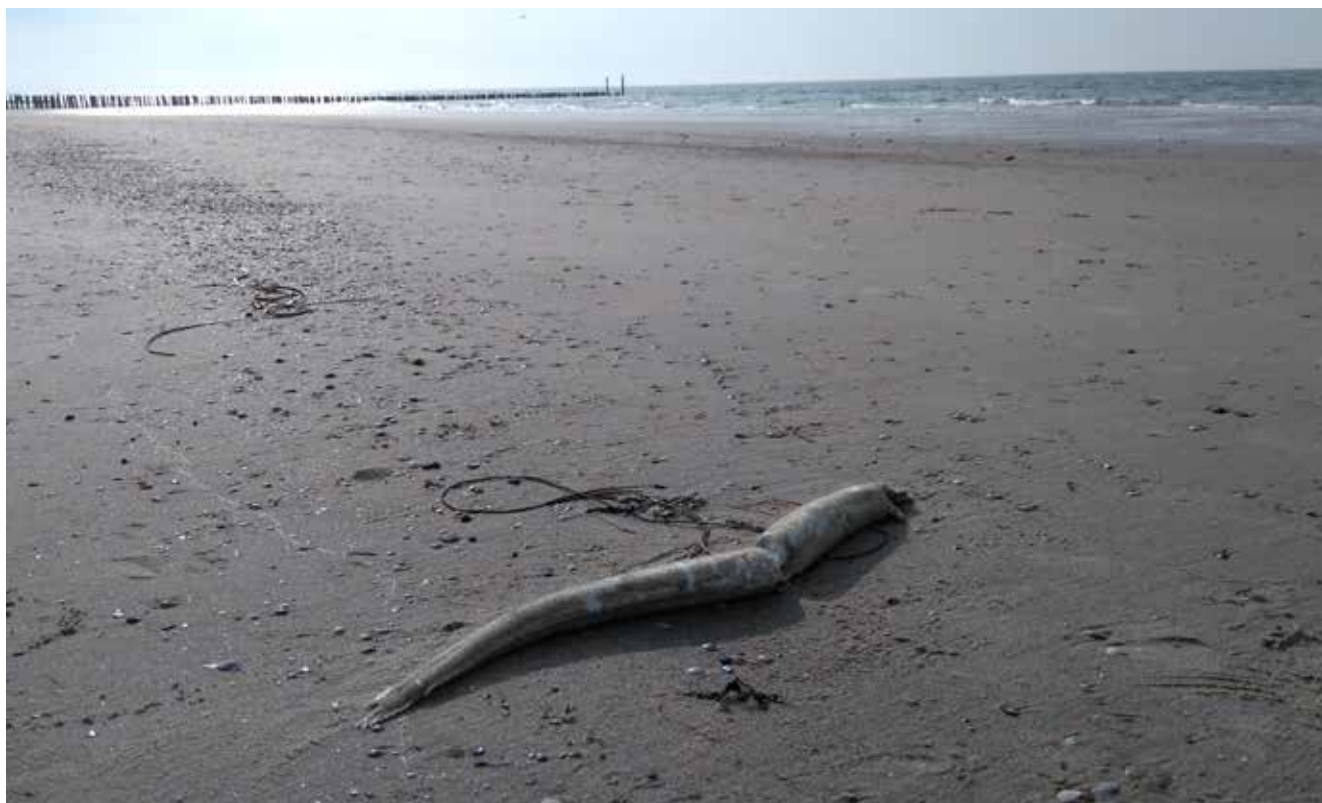
Figuur 5. 'Knakaal' als slachtoffer van pompwerking aangetroffen langs de boorden van de Westerschelde op het strand tussen Westkapelle en Zoutelande (NL) op 29 september 2017, het trieste lot van menig zilverpaling op weg naar zee.

2015 bedroeg het aandeel zilverpalingen die effectief de zee bereiken in Vlaanderen slechts 11% ten opzichte van een natuurlijke (niet door de mens verstoorde) referentietoestand (Belpaire et al. 2015a). Dit is nog ver verwijderd van de 40% ontsnapping die in de Europese Palingverordening als doelstelling werd vooropgesteld om het voortbestaan van de soort op lange termijn te garanderen.