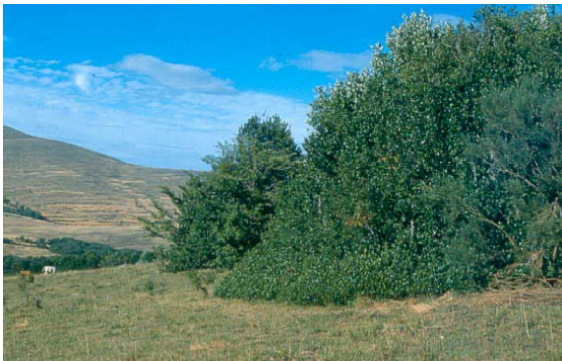
Foto 2. Acebo.