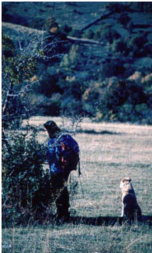
Foto1. Autora muestreando.

El acebo ( Ilex aquifolium L.) es una especie dioica, perennifolia, con un área de distribución situado básicamente en la Europa Atlántica, estando sus límites N y E condicionados por las bajas temperaturas (Peterken y Lloyd, 1967), y su límite S, en la península ibérica y montañas norteafricanas, por el estrés hídrico, al necesitar al menos unos 600 mm de precipitación anual (Oria de Rueda, 1992). En la Iberia eurosiberiana es muy abundante, mientras que en la región mediterránea suele estar asociada a ambientes frescos y húmedos, desarrollándose frecuentemente bajo pinares de Pinus sylvestris y melojares ( Quercus pyrenaica ). En zonas montañosas del centro peninsular, como el Sistema Ibérico Norte, o las inmediaciones de Somosierra en el Sistema Central, el acebo forma masas forestales casi monoespecíficas, denominadas localmente como acebedas, acebares o acebosas. A estas formaciones densas, inmersas en pastizales con mayor o menor grado de matorralización, se les atribuye un origen asociado al manejo del hombre (Costa et al ,