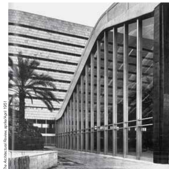
The Architectural Review, aprile/april 1951