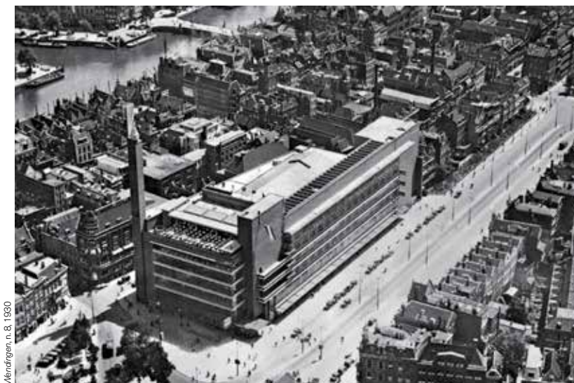
Wendig, n. 8, 1950