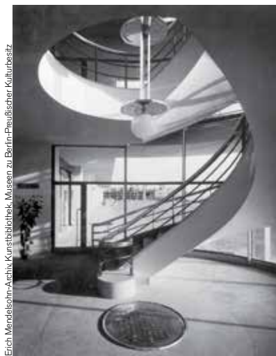
Erich Mendelsohn, Architektur, Kunstbibliothek, Museum zu Berlin