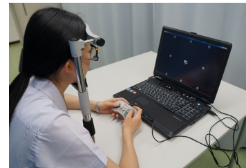
図2：抑制課題付有効視野測定法・高齢者版(VFIT-EV)

以上より、筆者らの前年度までの研究で実用視力は安全運転のための重要な視覚機能、認知機能(有効視野)運動機能(反応時間)の3要素を同時にスクリーニング可能な、運転適性のスクリーニ