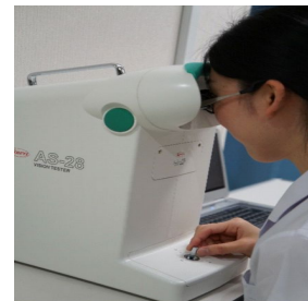
図3：実用視力計：患者はモニターに表示された視標に応じてジョイスティックを動かして回答する。一定時間連続して施行する視力検査