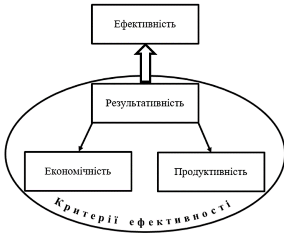
Рисунок 1 – Взаємозв'язок економічних категорій «ефективність», «результативність», «економічність» та «продуктивність»

На нашу думку, більш точно економічне ідентифікування даних термінів та їх розмежування в економічному сенсі можна виконати з використанням схеми «входу-виходу», принципова сутність якої представлена на рис.2.