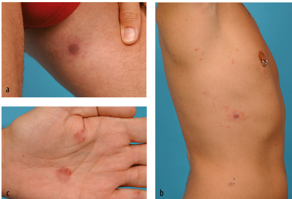
FIGUUR 1 Huidruptie bij presentatie van patiënt A met secundaire syfilis op (a) het linker dijbeen, (b) de rechter flank, met plaatsmarkeringen voor huidbiopten, en (c) de linker handpalm.

De partner van patiënt was asymptomatisch, maar bleek eveneens positief voor syfilis te testen (TPPA-test: 1:20480; FTA-abs-test: positief; VDRL-test: 1:64). Soa-screening bij de patiënt en zijn partner op hiv, hepatitis B, chlamydia en gonorrhoe was negatief. Algemeen neurologisch onderzoek toonde bij beiden geen afwijkingen. Wij bespraken het waarschuwen van andere partners en