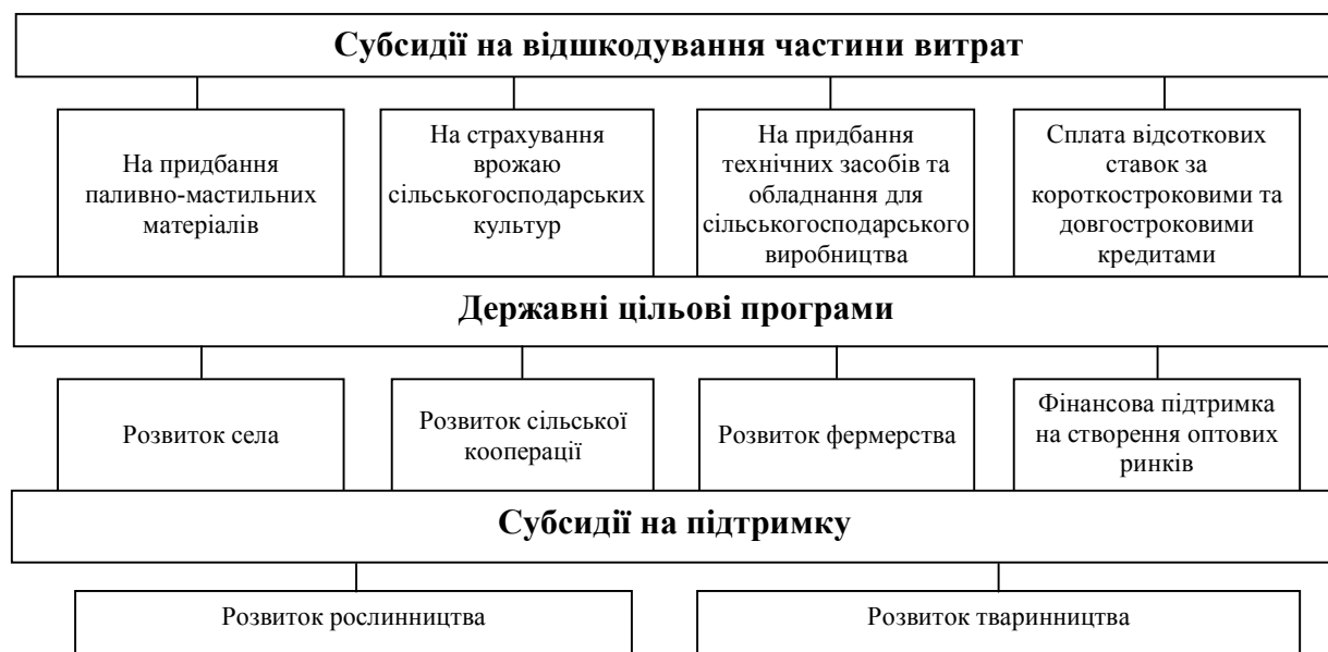
Рис. 2. Види державної підтримки в Україні [4]

Головними інструментами державної підтримки сільськогосподарських підприємств є дотації, субсидії, субвенції. Основні види державної підтримки в Україні наведено на рис. 2.