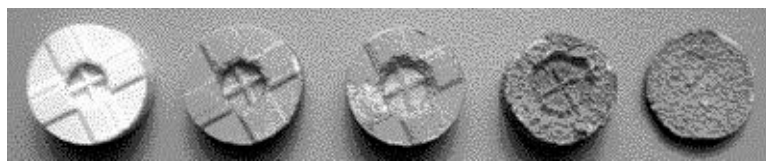
Рисунок 3 – Характер постепенного сгорания N&L-заряда

О характере горения N&L-зарядов можно судить по Рис.3, на котором показаны частично сгоревшие N&L-заряды при последовательном изменении момента прерывания их горения в стволе ружья.