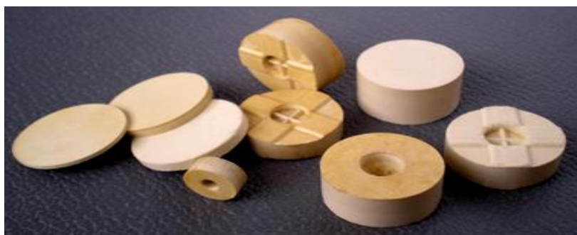
Рисунок 1 – Примеры пороховых элементов для охотничьего ружья 12 калибра и ПМ (9-мм), изготовленных по N&L-технологии

Как видно (рис. 1), пороховые элементы внешне похожи на брикеты овальной формы или таблетки, что послужило поводом для некоторых обозревателей назвать эти элементы таблеточным порохом. По-видимому, логично было бы назвать их N&L-порохом. Однако название не меняет специфиче-