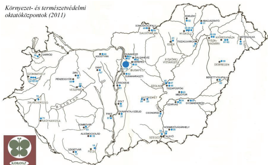
1. ábra: Az aktív környezeti oktatóközpontok földrajzi elhelyezkedése Magyarországon

A befogadó (működtető) intézmények/szervezetek szerinti megoszlásukat mutatja a 2. ábra. A kezdetektől napjainkig jelentős átstrukturálódás figyelhető meg. Gyarapodott az óvodákban, az egyesületi és vállalkozás keretében működő és nagymértékben csökkent a középiskolákban, a művelődési intézményekben és múzeumokban tevékenykedők száma.