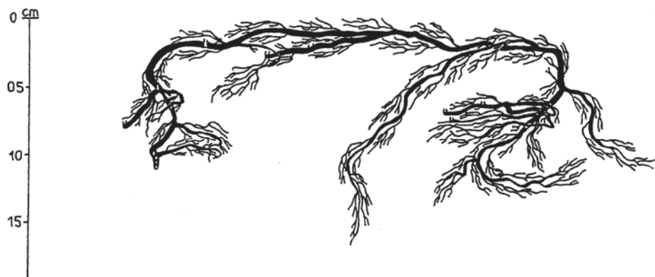
8. ábra: A IV. számú Euonymus europaeus mintacserje gyökérzetének vertikális térképe