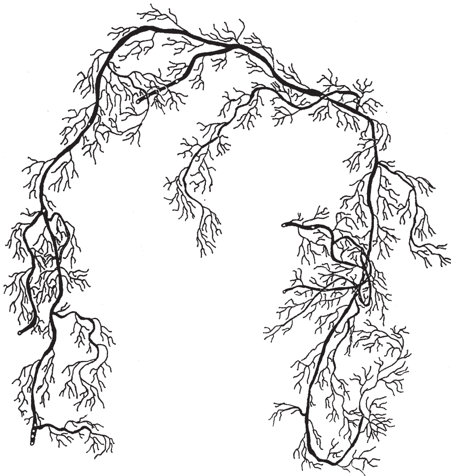
7. ábra: A IV. számú Euonymus europaeus mintacserje gyökérzetének horizontális térképe