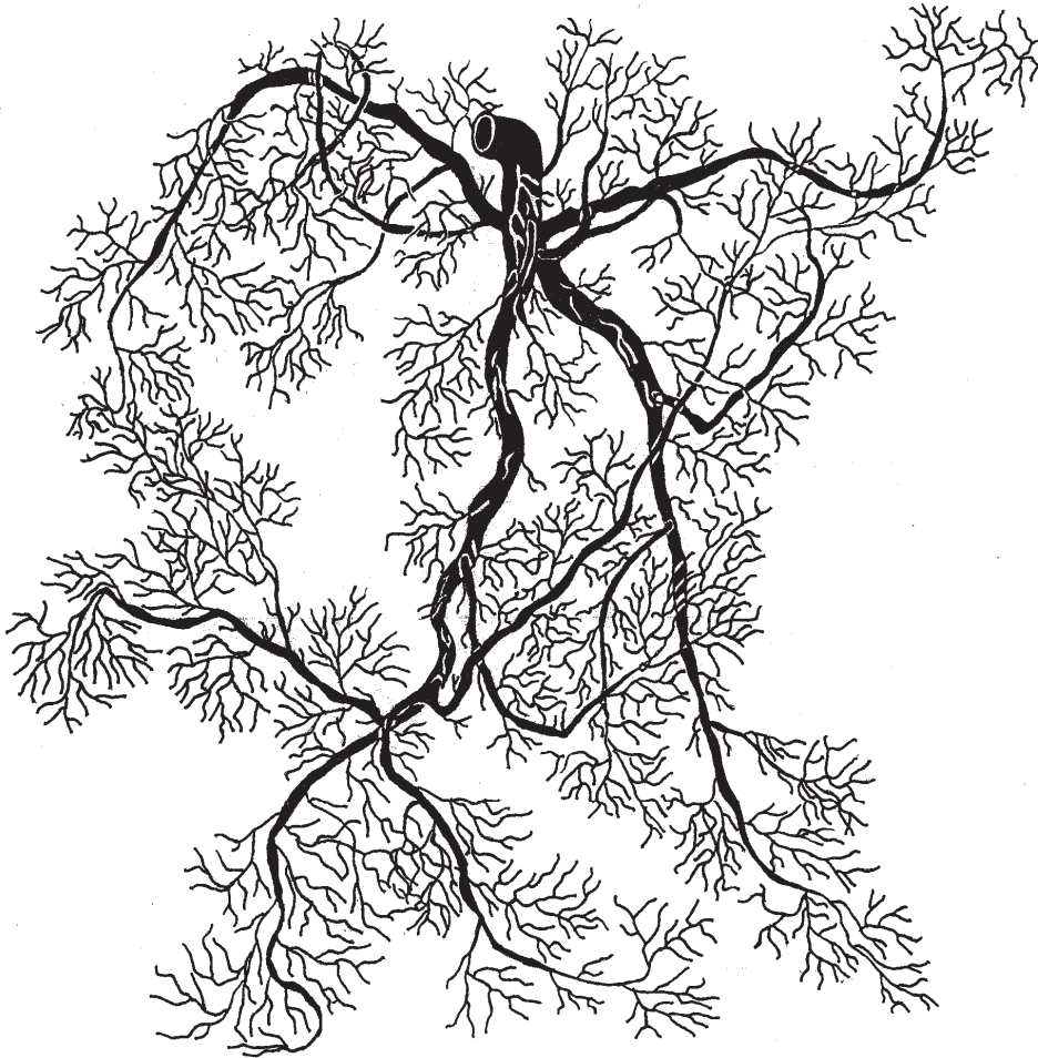
1. ábra: Az I. számú Euonymus europaeus mintacserje gyökérzetének horizontális térképe

zik, ezen belül a „járulékos gyökerekkel a részben vagy egészben a talajba mélyedő hajtásokon” típusba (1. csoport, 2. alcsoport, 2. típus).