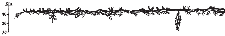
6. ábra: A III. számú Euonymus europaeus mintacserje gyökérzetének vertikális térképe