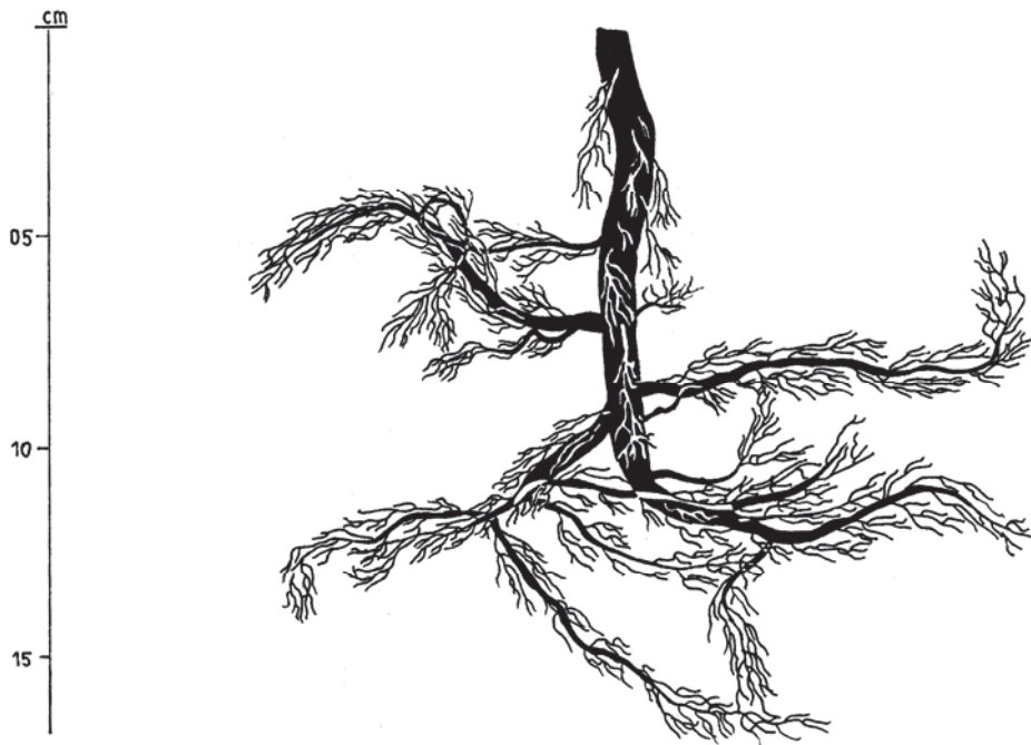
2. ábra: Az I. számú Euonymus europaeus mintacserje gyökérzetének vertikális térképe