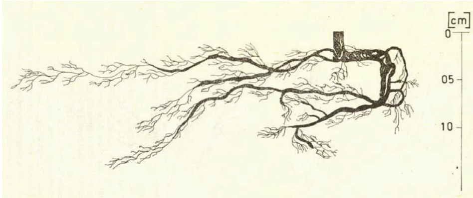
4. ábra: A II. számú Euonymus europaeus mintacserje gyökérzetének vertikális térképe