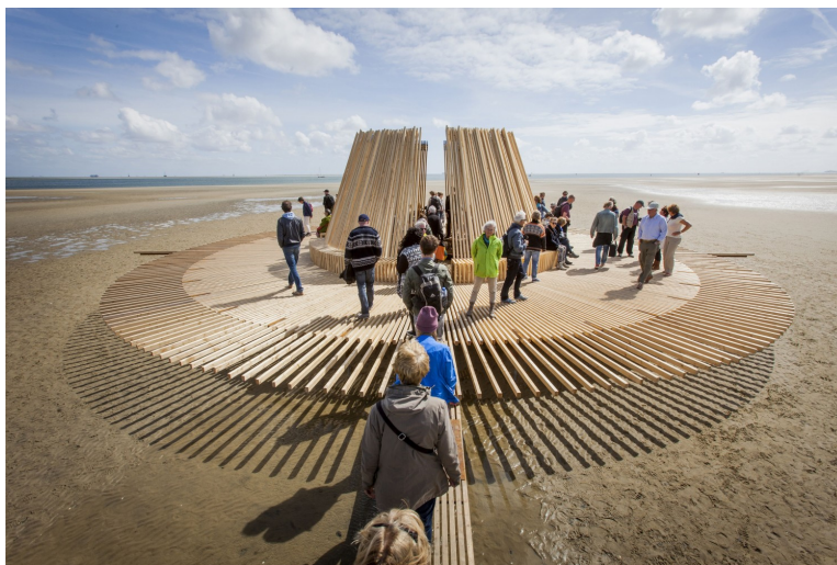
Afbeelding 1. Sense of Place, Joop Mulder. ( https://www.sense-of-place.eu/projecten/#all )

De identiteit en het karakter van een regio als een belangrijke leidraad voor cultuurprojecten zien we in de drie noordelijke provincies. 'Sense of Place' van Joop Mulder is zo'n project dat met cultuur diverse vraagstukken op het gebied van landschapsontwikkeling, natuurbeheer, community art, beeldende kunst, architectuur en erfgoed in het noorden aan de orde stelt (Raad voor Cultuur 2017)