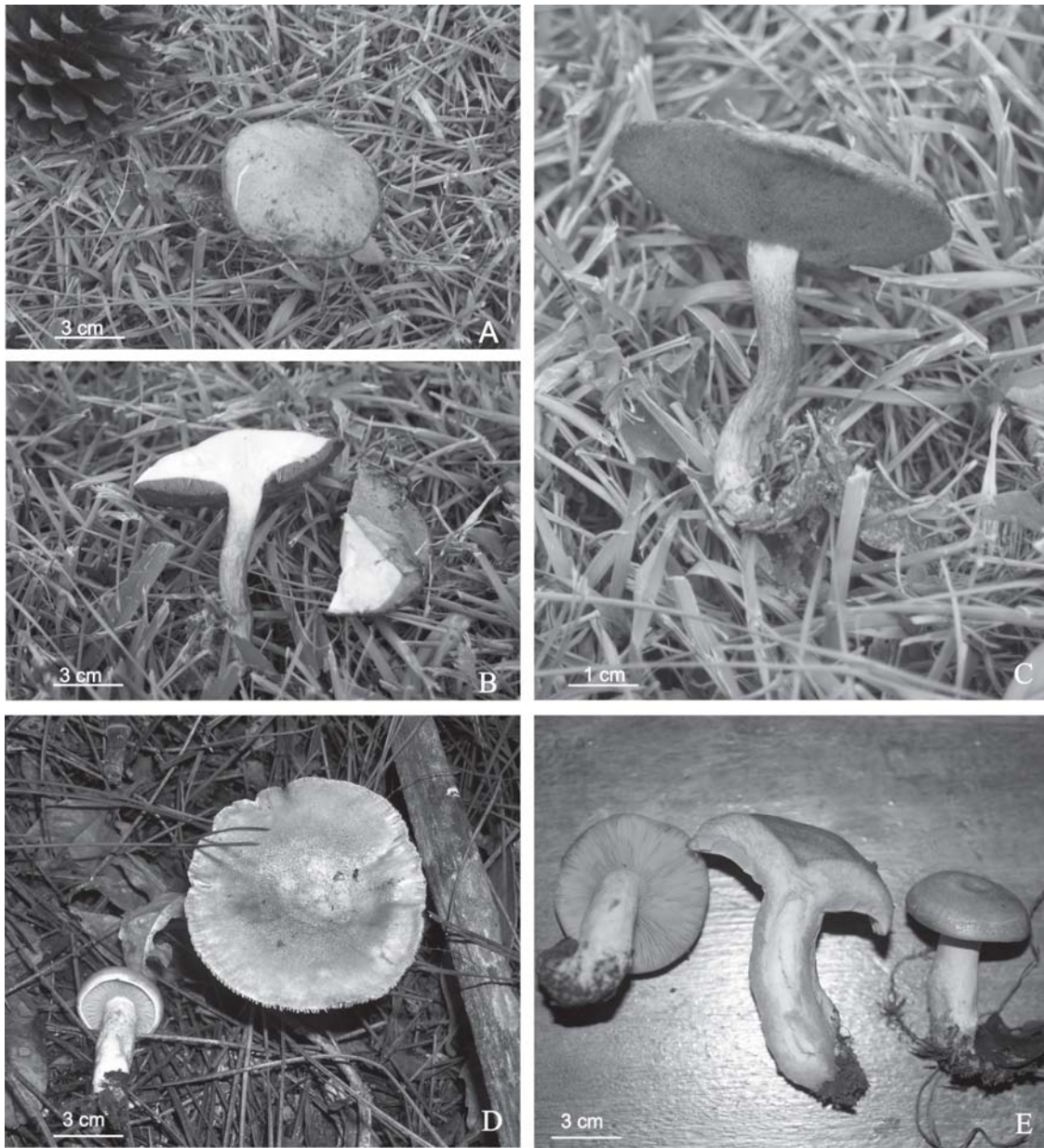
Fig. 3: A-C: Suillus granulatus : A, vista apical. B, corte longitudinal del basidiocarpo y desprendimiento de cutícula. C, vista lateral, se observan las granulaciones en la parte apical del pie. D-E: Lactarius deliciosus . D, aspecto general. E, corte longitudinal del basidiocarpo.

35-100 x 12-22 mm, central o excéntrico, cilíndrico, recto o curvo, hueco, seco, con una pruina blanca sobre el fondo anaranjado, escrobiculado, micelio basal blanquecino, escaso. Anillo ausente. Contexto carnoso a carnosos-esponjoso, blanquecino cuando joven, tornándose anaranjado oscuro, y verdoso en la