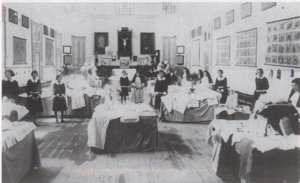
Exposició de l'any 1929

56, un grup comença estudis de Batxillerat i a finals de curs han d'examinar-se a l'Institut Maragall, Institut Verdaguer o a l'Isabel d'Aragó, a Barcelona.