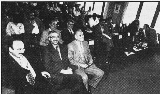
Convidats a l'acte d'obertura del Congr s.