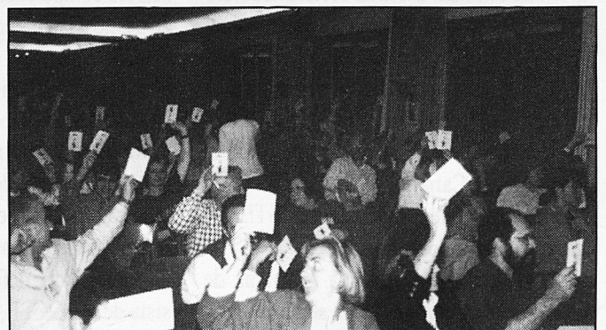
Delegats i delegades en una de les votacions.