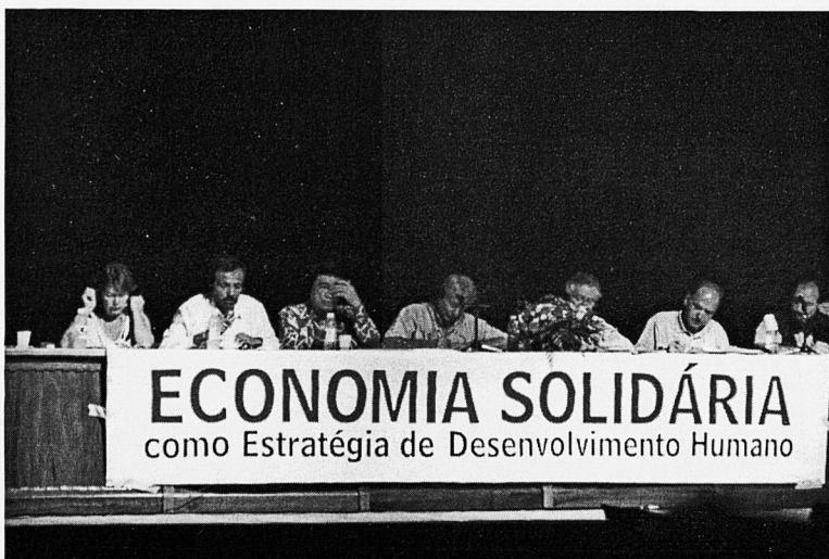
Una altra de les meses de l'FSM

- D'altra banda, quan es va fer l'augment de 50 nous sols al Bàsic, immediatament va sortir una nova