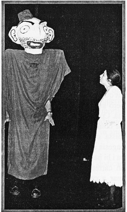
Imatges de la representació, amb trenta anys de diferència, de l'adaptació teatral de Jaume Vidal Alcover de "L'amor de les tres taronges"