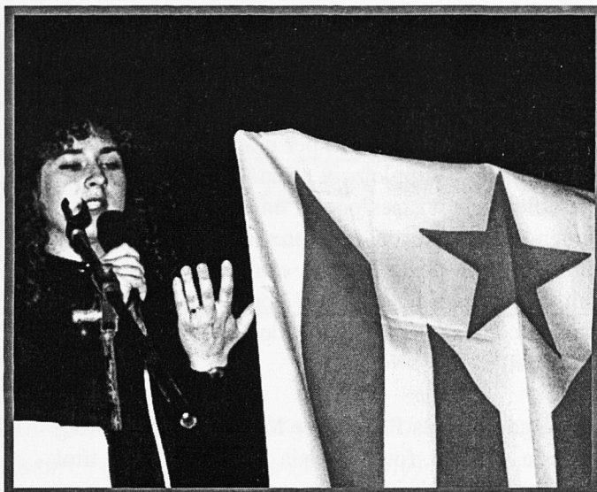
Recitació de la poesia de Jaume Vidal Alcover a la segona Diada Poètica de Magisteri Teatre - Mag Poesia (1994)