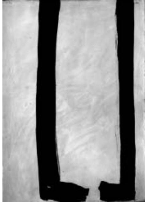
R. Canet. Sense títol 2007. Vinílica sobre paper 174 x 124 cm.