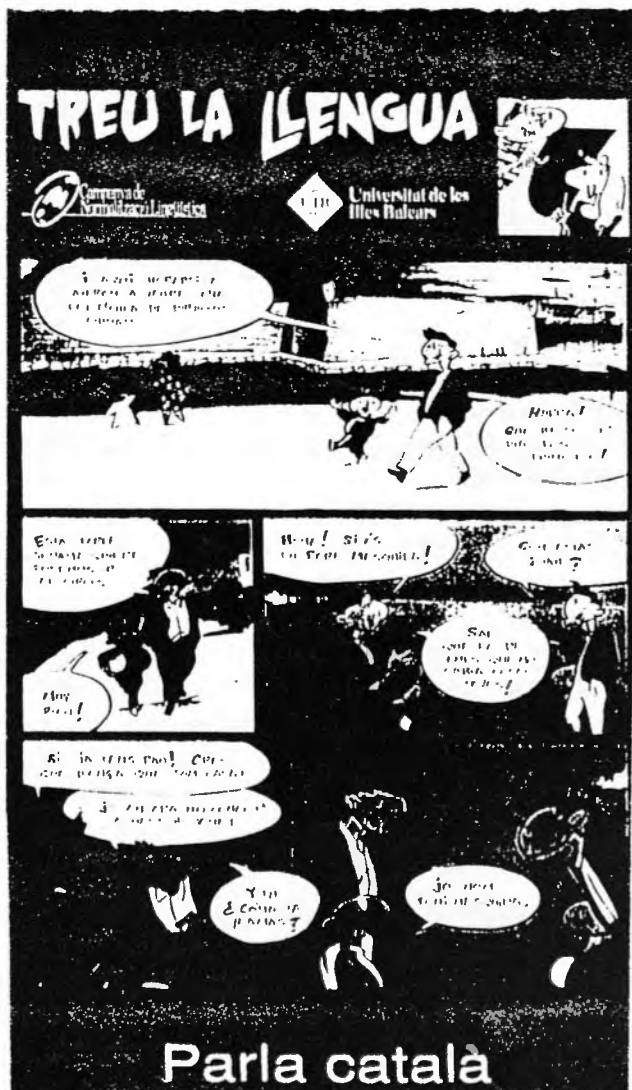
La UIB no ha tret la llengua als professors que fan les classes en espanyol ni a les seves publicacions

Vegem els resultats per llicenciatures i diplomatures. AQUESTS RESULTATS SÓN ABSOLUTAMENT VERAÇOS, JA QUE S'HAN OBTINGUT PRÀCTICAMENT SOBRELA TOTALITAT DELS MÉS DE 400.000 CRÈDITS QUE ENGUANY HAURÀ DISPENSAT LA U.I.B. (7)