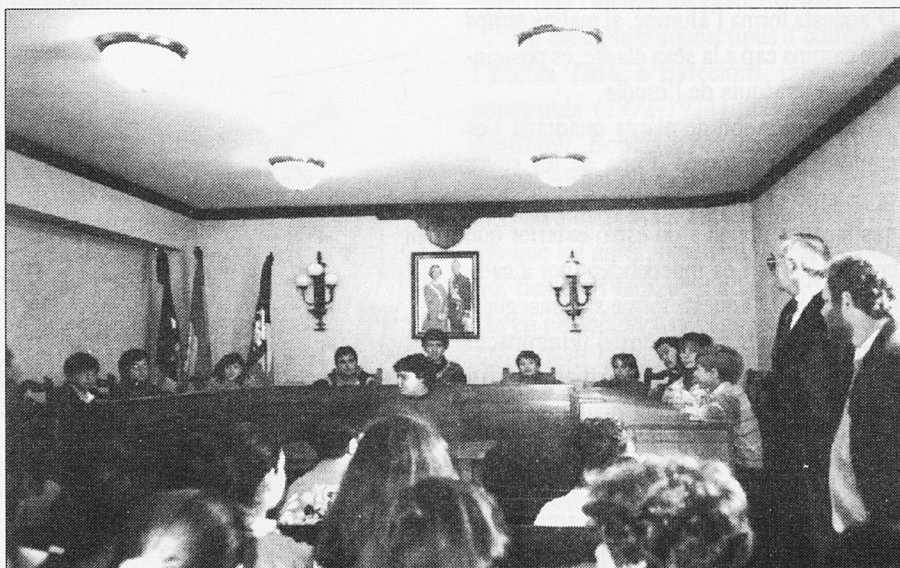
Presència d'escolars a les dependències de l'Ajuntament de Sant Llorenç

A nivell general, el material es compon d'una sèrie de dossiers informatius o guies per al professorat, alguns estan complemen-