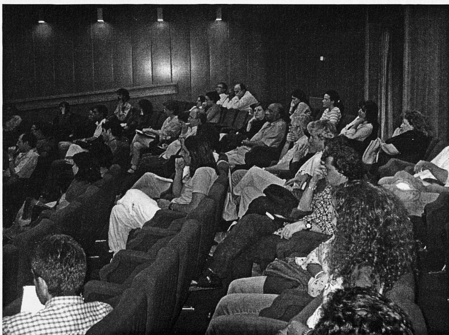
Públic assistent a la conferència que Atilio A. Boron va fer a Palma com a cloenda del seminari Globalitzem la Justícia, organitzat per l'STEI-i

D'existir alguna veu popular que sorgeixi en la regió, algun tipus de moviment democràtic, podria convertir-se en alguna cosa similar a l'ocorregut a Algèria fa 10 anys. No seria necessàriament un radicalisme islàmic, sinó un corrent de l'Islam més enèrgic que el que actualment existeix en molt països. Crec que aquest seria l'últim desig dels Estats Units, de manera que, molt probablement, tota alternativa d'obertura democràtica es trobaria immediatament amb una fèrria oposició de la Casa Blanca.