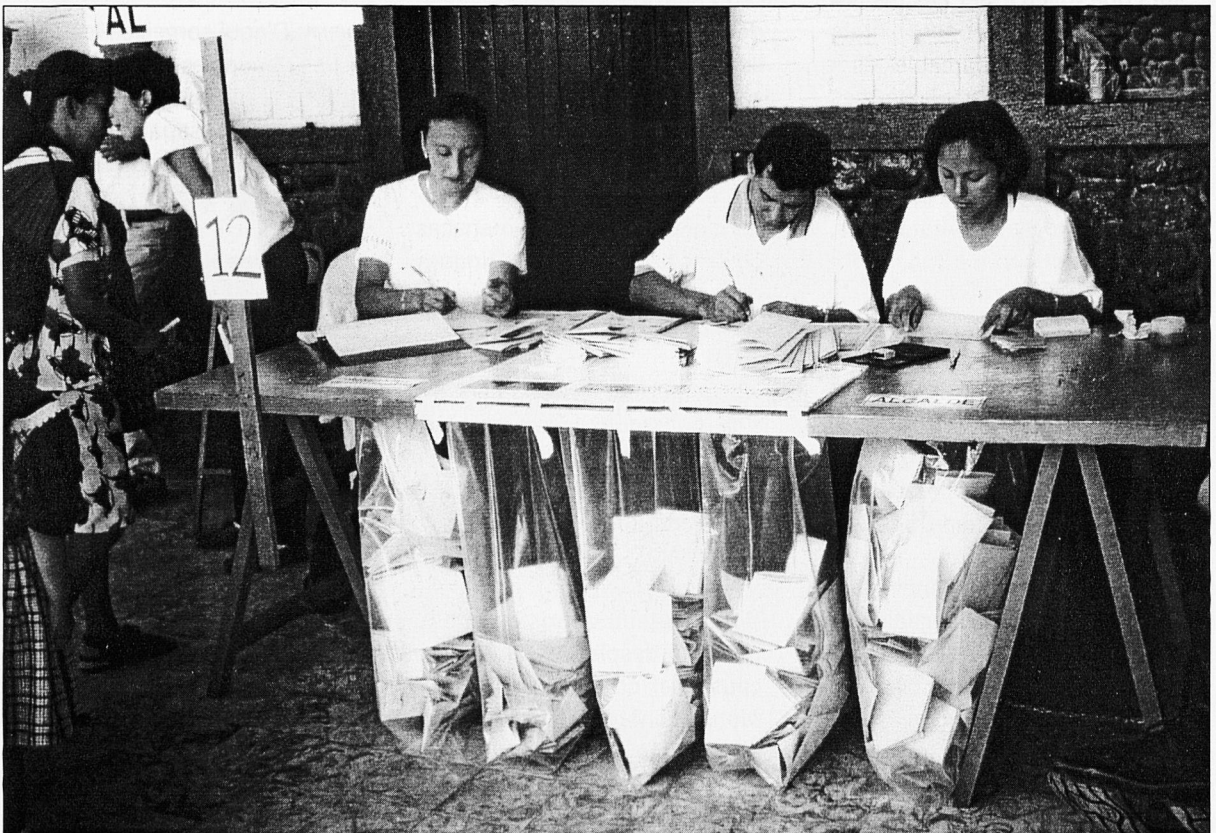
Mesa de votació.

- La lentitud del procés de votació fa que si l'assistència a les meses és àmplia al final de la jornada quedi molta gent sense