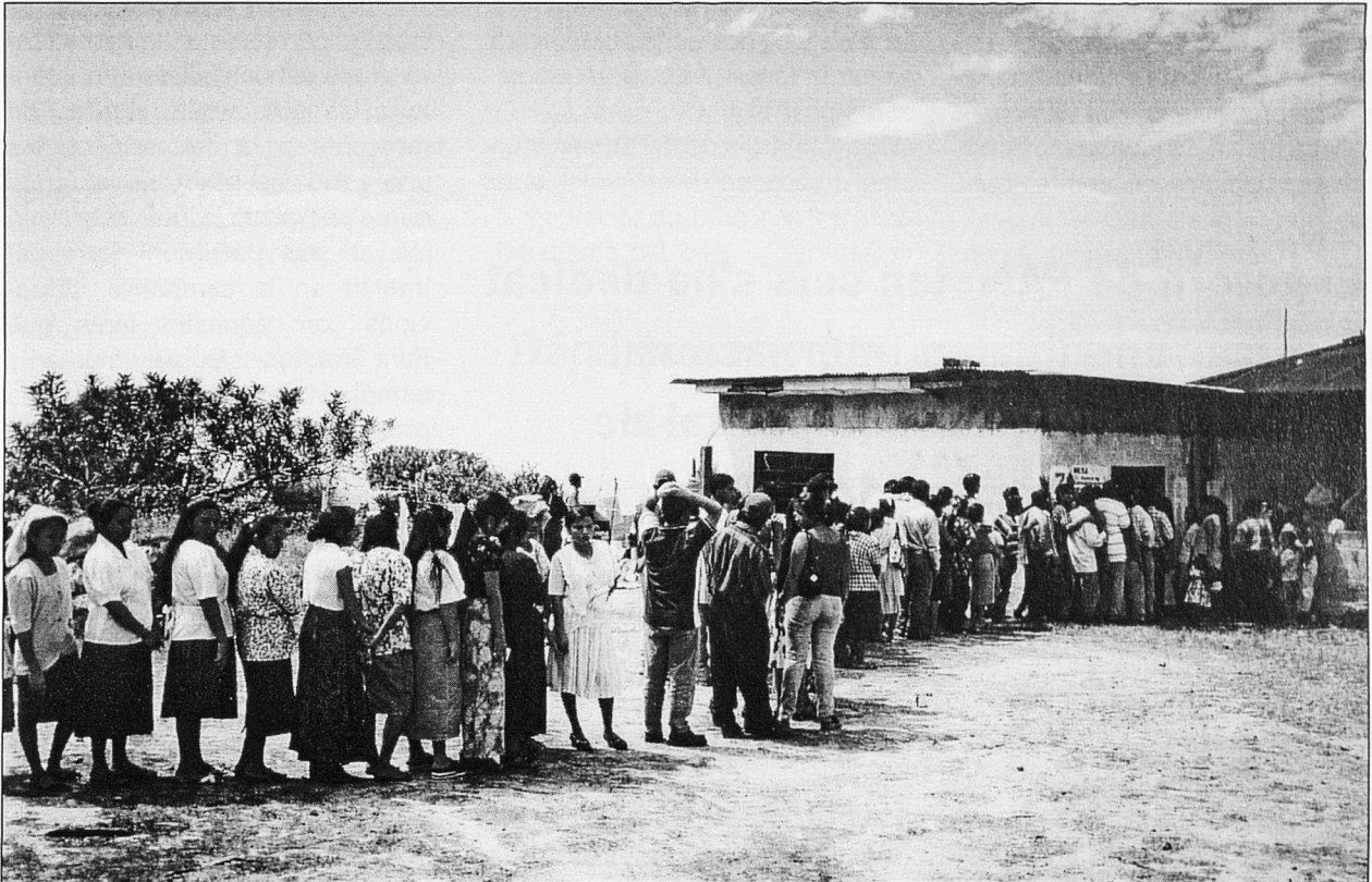
Cues davant els col·legis electorals.

poder votar, ja que els col·legis electorals es tanquen a les sis de l'horabaixa, encara que molta de gent hagi realitzat de manera estoica llargues cues, cosa que ens fa admirar el desig de participació i el sentit cívic de la majoria del poble guatemalenc.