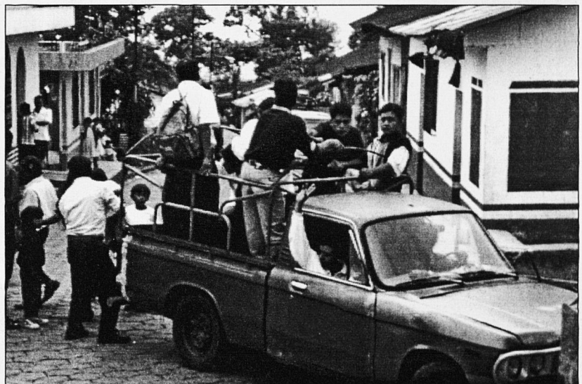
El transport va ser clau a l'hora dels resultats.

- S'entrega una papereta gegant on es troben tots els partits que es presenten, l'elector ha de marcar amb una creu la seva decisió, posar-la dins d'un