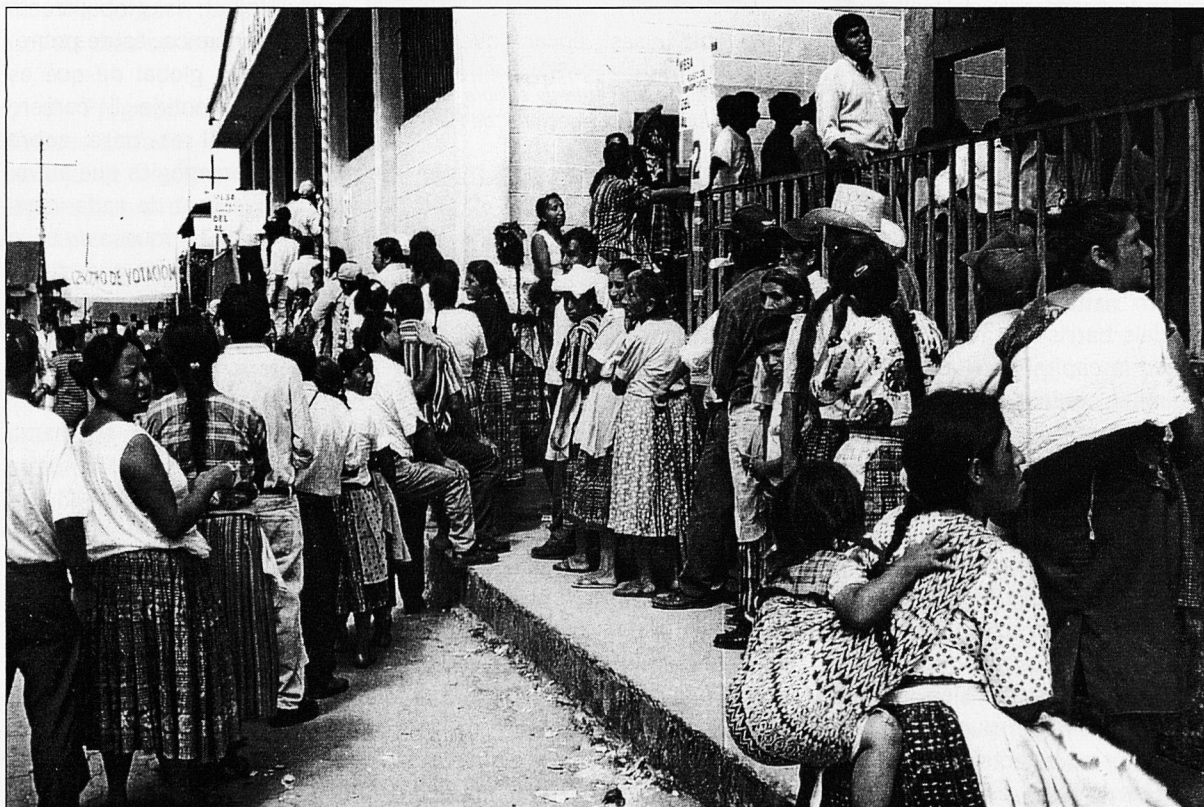
Cues davant els col·legis electorals.

tracta d'una visió parcial, de les experiències viscudes en aquests dies i del coneixement del país adquirit durant els darrers anys, com a participants i coorganitzadors de projectes de solidaritat a diferents sectors guatemalencs.