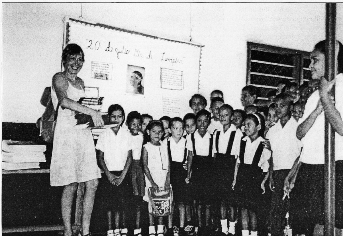
Entrega de llibres a una escola.

En les reunions que havíem tingut a l'STEI abans de partir