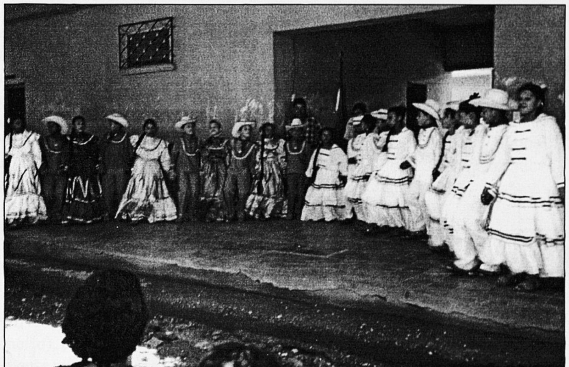
Moment de la clausura dels tallers.

Procurador dels Drets Humans a Guatemala, havia visitat al grup de mestres que en un principi havíem manifestat interès per dur a terme el Programa de Solidaritat amb Amèrica Llatina.