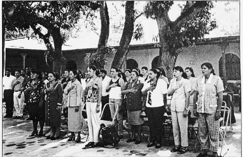
Moment de la inauguració dels tallers.

Per a la preparació del meu taller vaig tenir molt en compte les paraules de Julio Roca que, com a