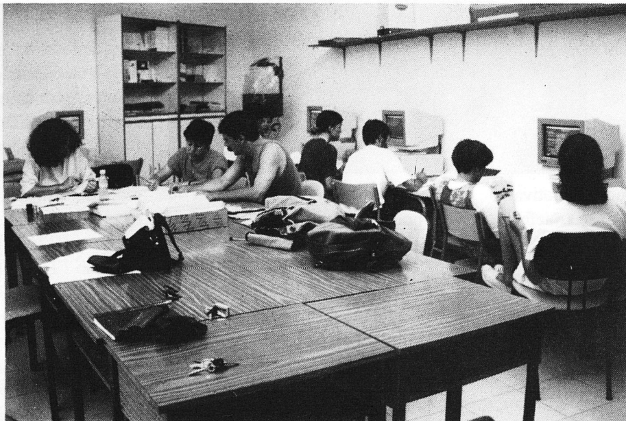
Setmana de Renovació. Estiu 93