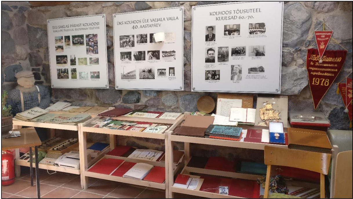
Foto 8. Kolhoosiesemete väljapanek Sakla muuseumis.