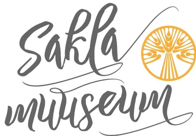
Joonis 1. Sakla muuseumi logo. Autor Mart Varik, idee Aivo Põlluäär.