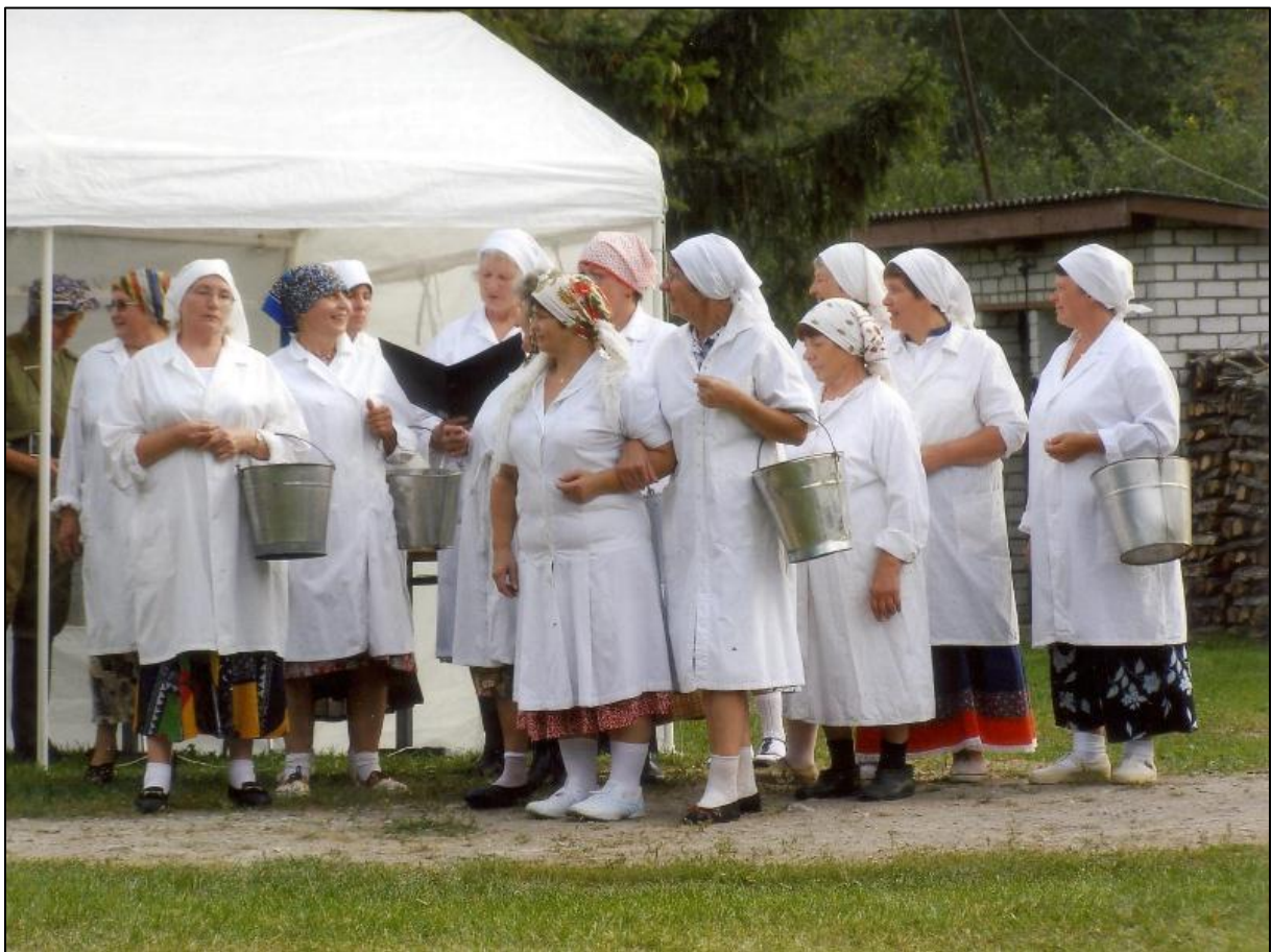
Foto 9. „Lüpsikute tants“ kolhoosi 60. aastapäeva peol Sakla seltsimaja õuel. (Avo Reino)