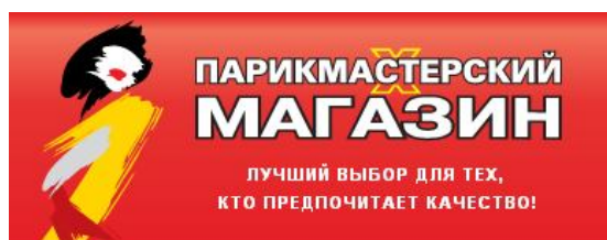
Рис. 1 – Логотип и девиз компании

Девиз – «Лучший выбор для тех, кто предпочитает качество!» (рисунок1).