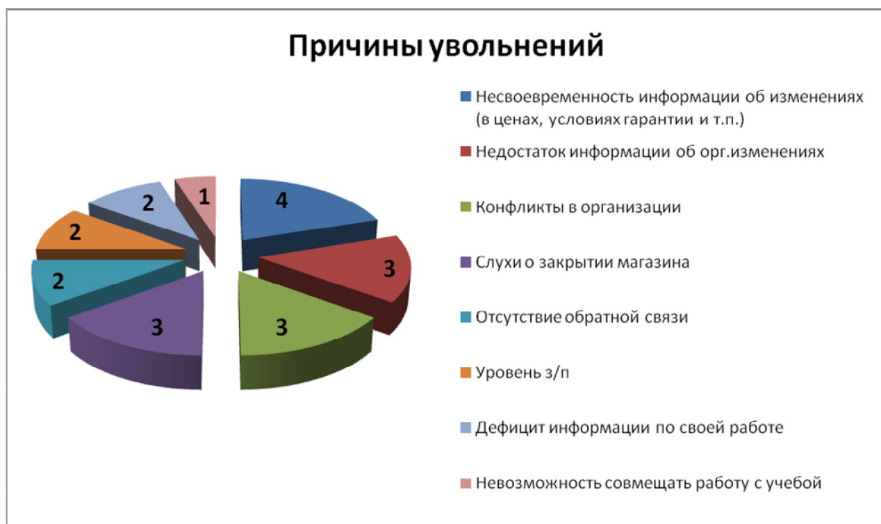
Рисунок 3 – Анализ причин увольнений персонала, 2016 г.

Данные таблицы 4 показывают, что за анализируемый период численность АУП снизилась на 11%, удельный вес специалистов увеличился на 6,25%. Коэффициент прибытия выше коэффициента выбытия, т.к. организация создает новые рабочие места. Уровень текучести кадров выше нормы, которая составляет 5% в год. В организации уровень текучести кадров в 2016 г. составил 15,6%.