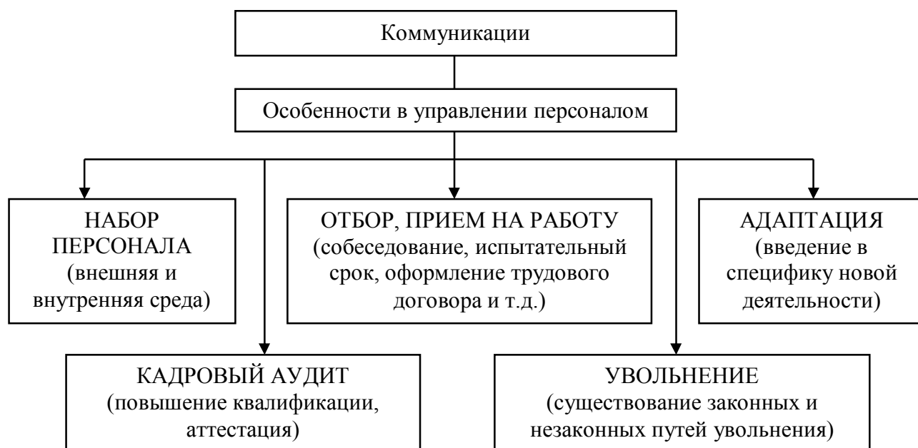
Рис. 4 – Особенности коммуникаций в управлении персоналом

Любая из функций руководителя службы персонала требует достаточных способностей в области коммуникации, т.е. коммуникативная компетентность является неременным элементом профессиональной пригодности менеджера по персоналу.