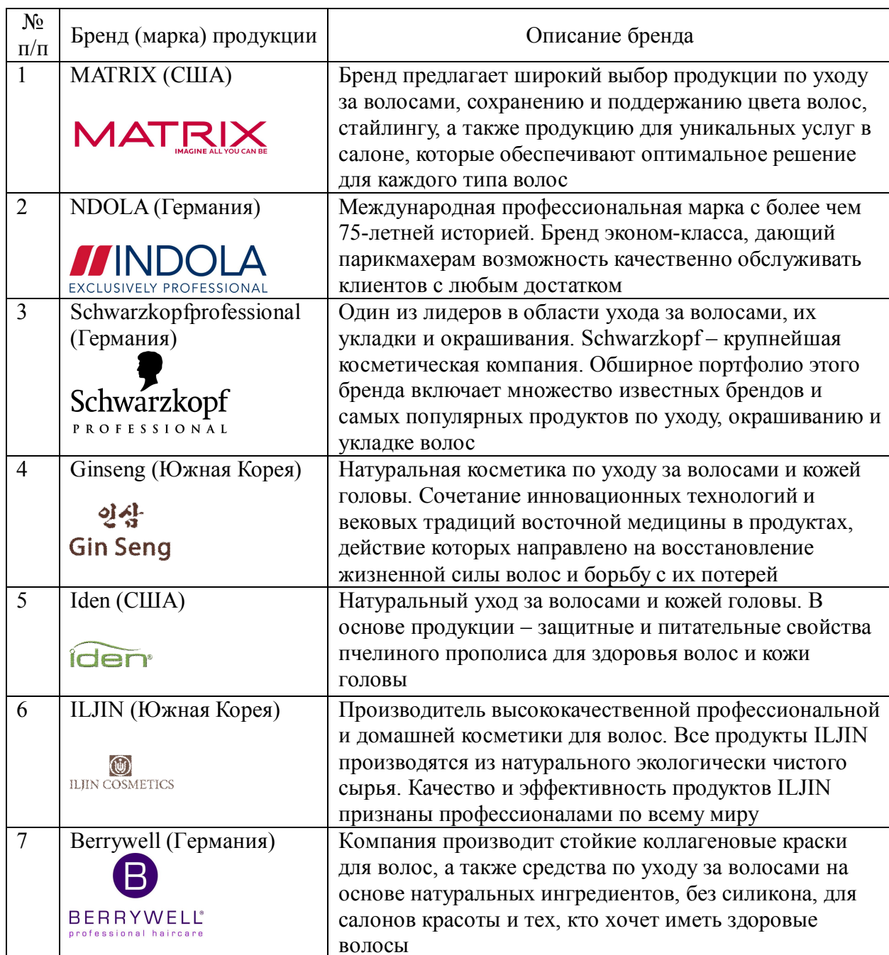
Таблица 1 – Ассортимент продукции магазина

В магазине представлены следующие марки парикмахерских инструментов: