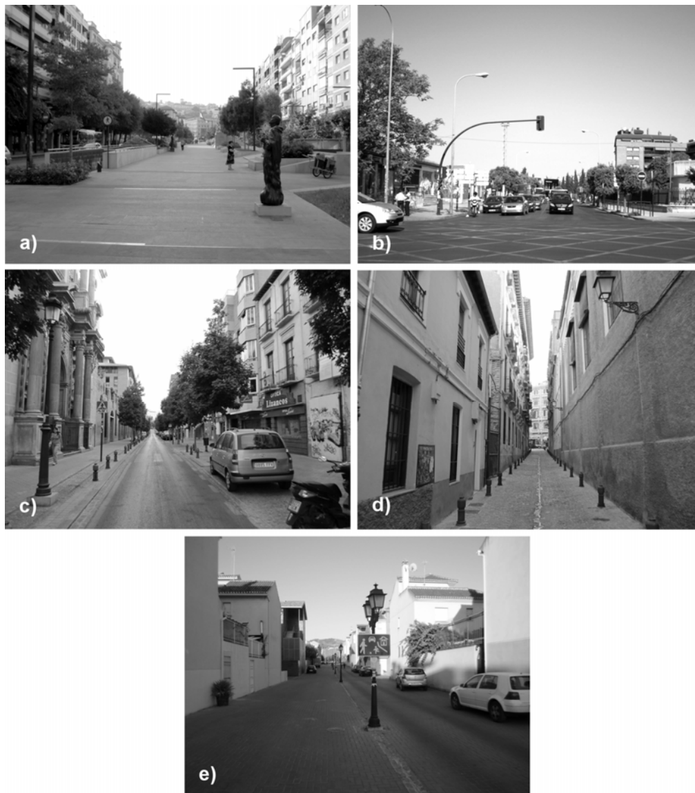
Figura 3: Tipologías de calle, a) bulvar, b) colector, c) comercial, d) histórica, e) residencial.