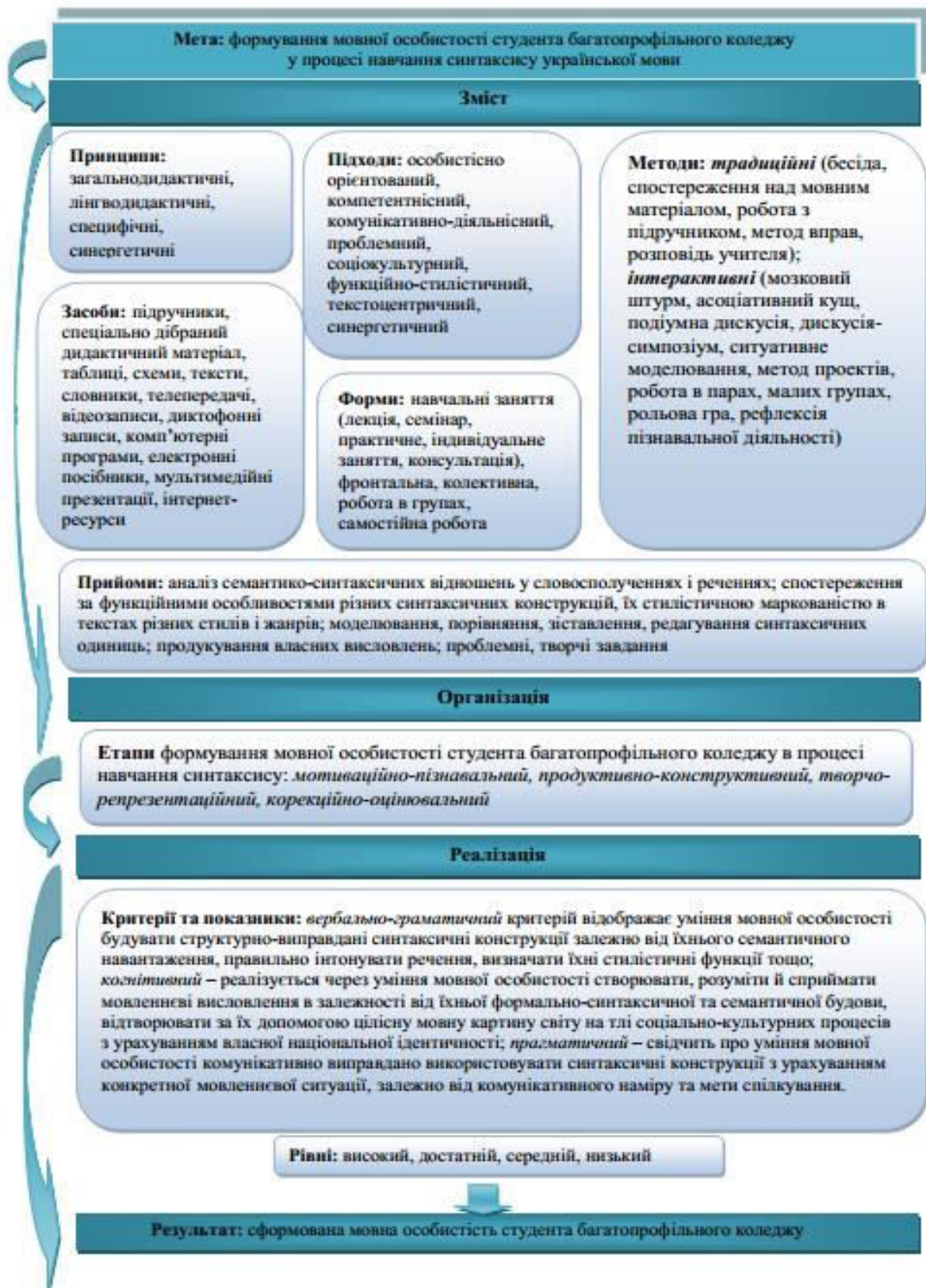
Рис. 1. Лінгводидактична модель формування мовної особистості студента у процесі навчання синтаксису в багатoproфiльних коледжах