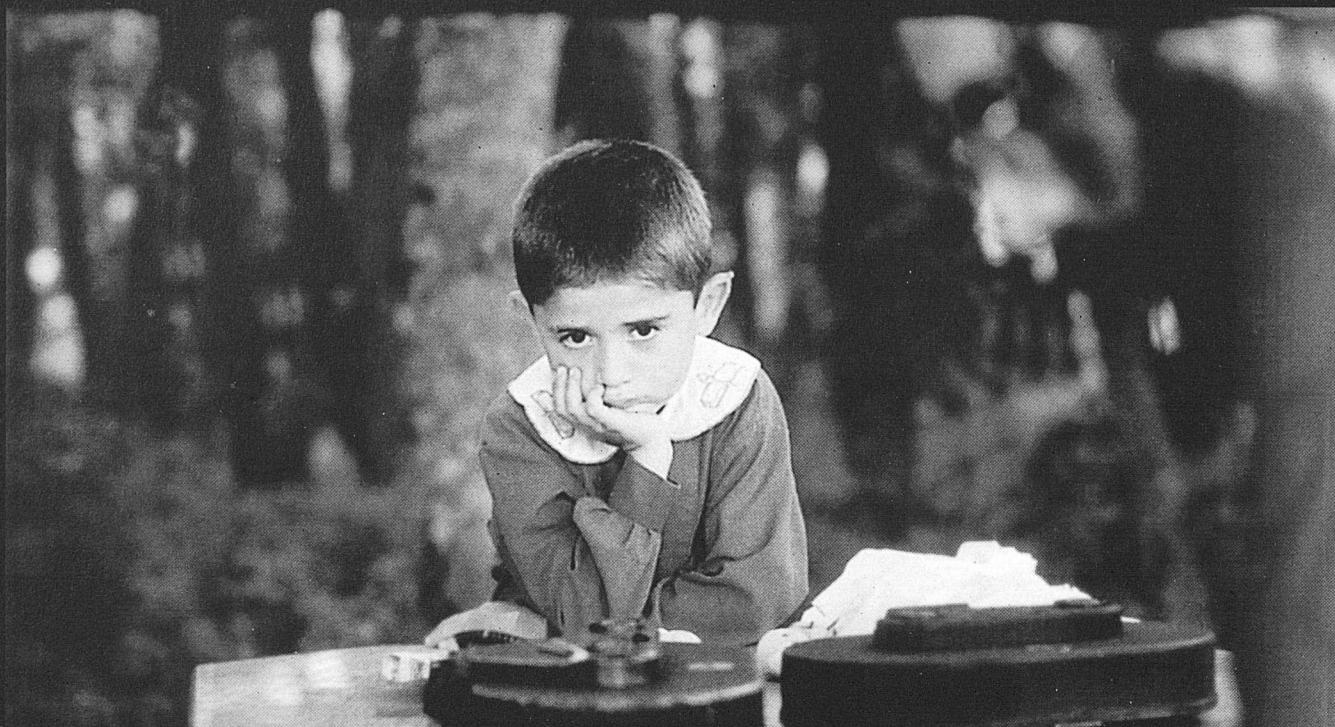
Nubes de mayo