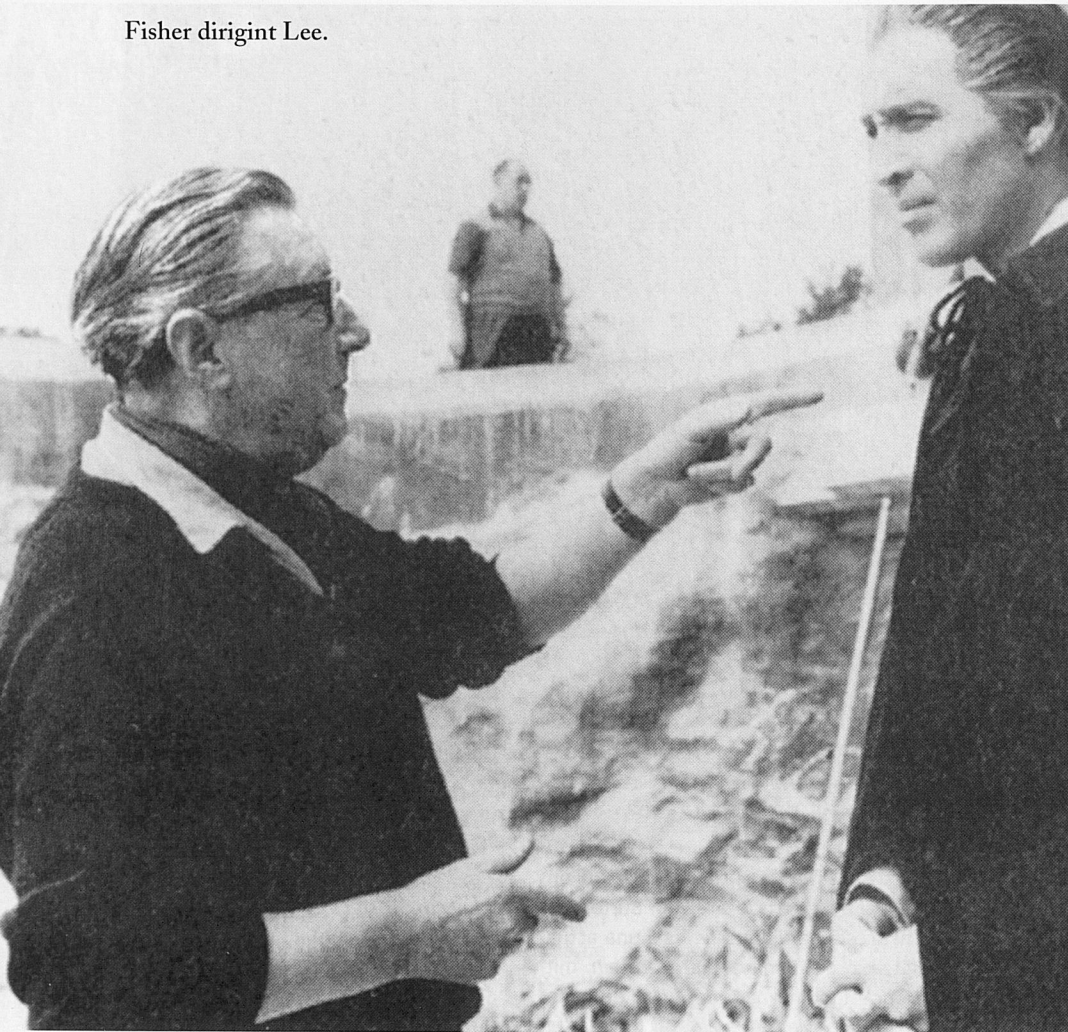
Fisher dirigint Lee.