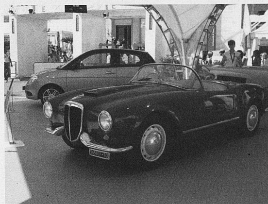
El Lancia que conduí Gasmann a Il Sorpasso .

A Venècia un dels temes de conversa era el proper festival de cine de Roma, que promogut pel batlle de la ciutat Walter Veltroni i pel president de la Fondazione Musica per Roma Goffredo Bettini, se celebrarà per primera vegada el proper mes d'octubre, del 13 al 21. Tot i que es vol donar una imatge de "no passa res, no hi ha competència" des de Venècia els comentaris no eren gaire favorables, criticant sobretot el fet que ara els doblers públics s'hauran de repartir. Un dels punts febles de Venècia són les infraestructures, aspecte en el qual Roma duu avantatge. Al diari La Repubblica es podia llegir un article que comentava "és una guerra freda, in-