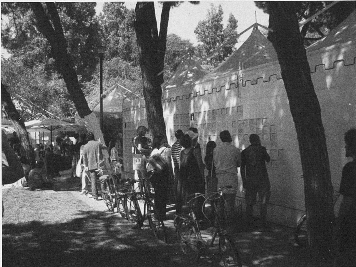
Les crítiques, a la Mostra i a les pel·lícules que es projectaven, donaven la volta a tot el recinte destinat a acollir-les.