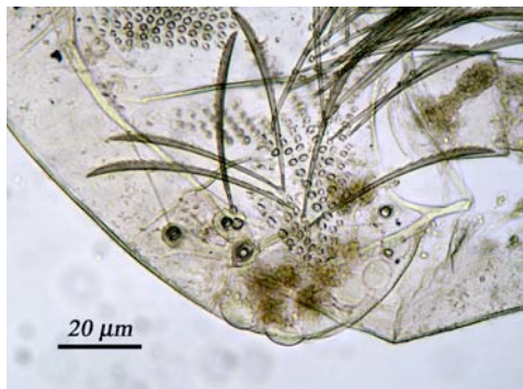
Fig. 2. Insección tricomas y tricobotrio frontales. Fig. 2. Insertions of trichomes and frontal trichobothria.

Clípeo hacia la zona del labro con numerosas sedas y que oscilan con unas longitudes entre las 21.5 \mu\text{m} las más pequeñas a 57 \mu\text{m} las más grandes.