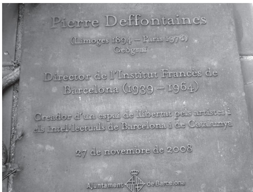
Placa oferta per l'Ajuntament de Barcelona l'any 2008, en homenatge a Pierre Deffontaines .