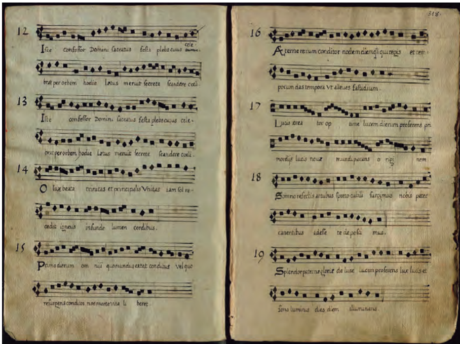
FIGURA 3. Exemples de cant pla (himnes) de la Consueta de 1595-1655, f. 317v-318r.

En cas que la festa coincidís en segon, tercer o quart diumenge, es feia com si fos un diumenge ordinari amb les convenients vespres i la novena lectura de l'homília i l'evangeli del diumenge. Acabada la missa es feia la processó. Si coincidia en diumenge de Passió, es traslladava al següent dia que es pogués, tot i que no es traslladava la processó, que es feia el mateix diumenge. Si queia en diumenge de Rams, es feia després del primer diumenge de Resurrecció. Els himnes fins a l'església de Sant Feliu es cantaven amb música pròpia del temps de Pasqua. 13 En la Consueta trobem les diferents melodies litúrgiques de cant pla que sonaven en cada una de les festivitats: himnes, antífones i salms —vegeu en la figura 3, per exemple, uns himnes de la Consueta de 1595-1655 amb notació musical.