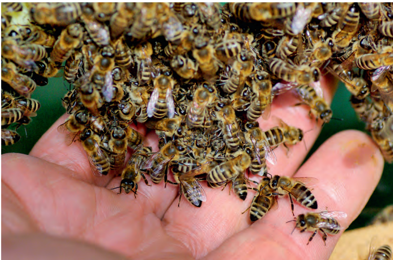
Zachtaardige carnica.