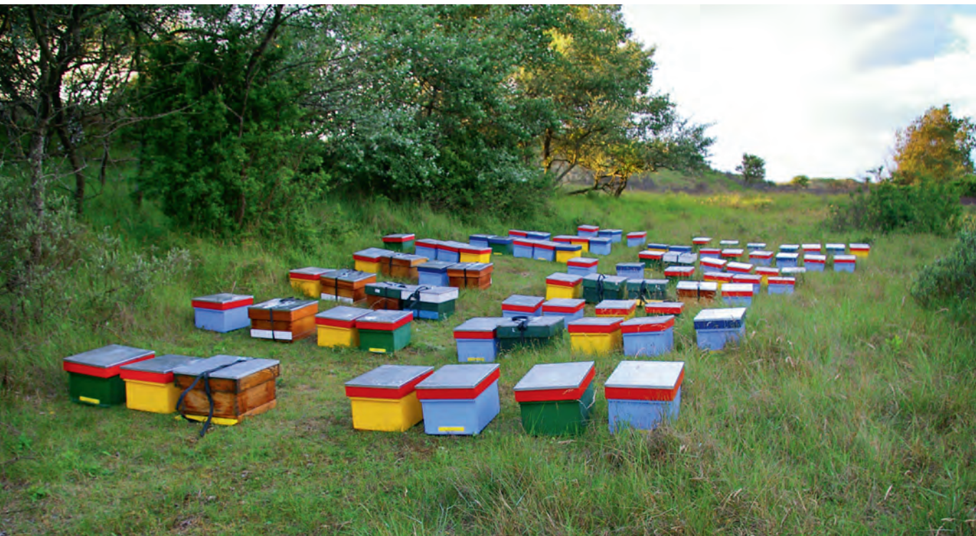
Bijenkast in proef van Bijen@wur.

Het centrale probleem bij de beantwoording van deze vraag is dat gecontroleerd bevruchten bij honingbijen lastig is. De eenvoudigste en goedkoopste manier van bevruchten is standbevruchting, maar doordat jonge koninginnen bereid zijn ver te vliegen op zoek naar darren, en darren ook een eind vliegen om koninginnen te vinden, heeft de imker absoluut niet in de hand met welke darren bevruchting plaatsvindt. Als hij dus nateelt van een volk dat hem bevalt (of dat nu is via redcellen of via overlarven) en er vervolgens standbevruchting plaatsvindt heeft hij op de mannelijke helft van de afstamming van de nieuwe werksters geen invloed. In het geval van semi-natuurlijke selectie is het idee dat er op verschillende plaatsen in Nederland lokale initiatieven ontstaan waar gewerkt wordt op soortgelijke wijze als Bijen@wur en De Vitale Bij, om op die manier meer weerstand tegen varroa te verwerven. Het betekent natuurlijk wel dat bij de paring gezocht moet worden naar een plek die voldoende geïsoleerd is van andere volken, deels te bereiken door een overmaat aan darren te produceren van de gewenste afstamming.